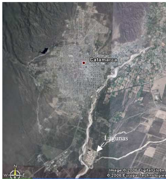
Plano N°1. Ubicación de la planta de tratamiento de efluentes Cloacales de la capital de Catamarca

La planta de efluentes cloacales de la ciudad Capital está integrada por seis módulos, que funcionan en paralelo. Cada módulo está integrado por una serie de cinco lagunas: una anaeróbica, seguida de una facultativa y tres de maduración (primaria, secundaria y terciaria). El sistema ocupa una superficie total de 1,50 km 2 y está ubicado al Sur - Este de la ciudad Capital, entre los ríos Del Valle y Santa Cruz, sobre la margen este del río Del Valle, en la localidad de Antapoca, Dpto. Valle Viejo (Plano N° 1). La planta fue diseñada para tratar 444 l/s de efluente.