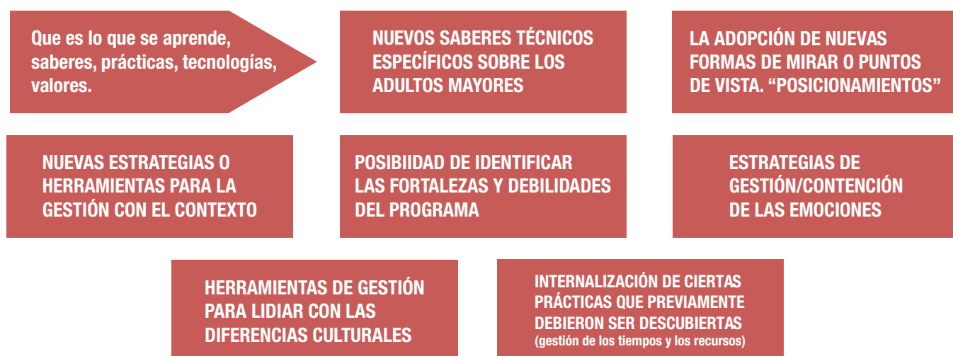
Gráfico 2. Tipos de Aprendizaje Organizacional

Cabe destacar como una reflexión adicional en relación con este proceso, que es la dificultad en los miembros de las organizaciones estudiadas de poder evocar e identificar los aprendizajes realizados a partir de la resolución de los problemas que enfrentan en la consecución de sus objetivos. También se pierde la noción de evolución a través del tiempo, no recuerdan con precisión las etapas/períodos/momentos en los que se reorientó la acción en función de los cambios propios o del contexto organizacional. Los aprendizajes no se registran, se naturalizan e incorporan al devenir cotidiano.