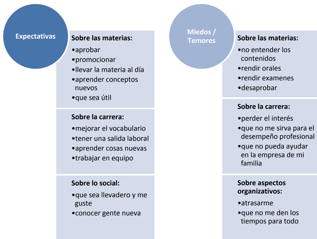
Ilustración 2 Respuestas más comunes dadas por los grupos

En cuanto a las producciones de la segunda actividad, sobre que imaginan hace un Licenciado en Administración, los resultados fueron muy variados en cuanto a ideas sobre habilidades que debe tener, roles que puede desempeñar y tareas que realiza, sin embargo la gran mayoría estuvo orientado en cuanto a en qué organizaciones puede trabajar.