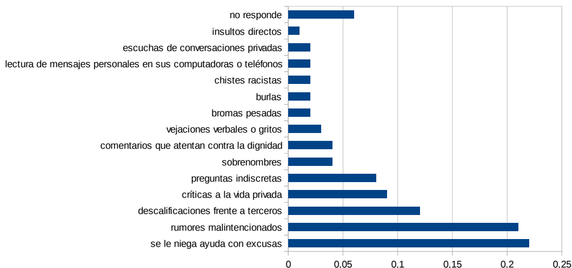
Manifestaciones de violencia en las comunicaciones