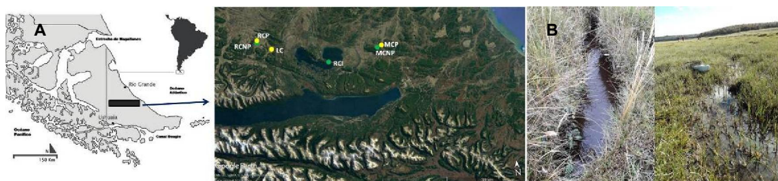
Figura 1. A. Mapa del área de estudio con los seis sitios de muestreo en el centro de Tierra del Fuego. (modificado de Caruso Ferme (2016)). Por referencias ver texto. B. Fotografías de un sitio no pastoreado y uno pastoreado.

Río Ona (RCNP aguas arriba de RCP) de la cuenca del Río Grande, el sitio RCI se sitúa sobre el Río Mimica de la cuenca del Río Claro y el arroyo en LC pertenece a la Cuenca del Río Fuego. Todos los cursos presentan una pendiente del terreno no mayor a los 10° y desaguan finalmente en el Océano Atlántico.