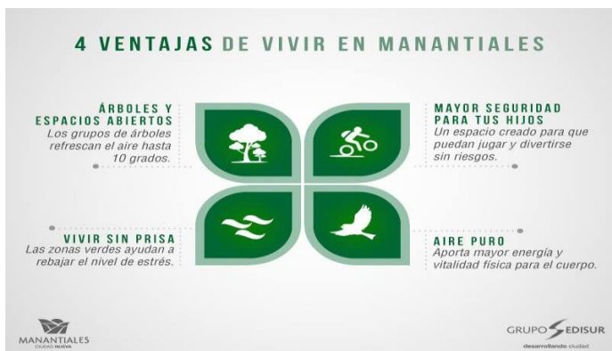
Publicidad Manantiales Grupo Edisur, página de Facebook 07/02/15.

Más allá de los segmentos de clase a los que se encuentran dirigidas las publicidades, podemos identificar significados relativos a un determinado estilo de vida deseado, urbano pero con aire de “tranquilidad rural”, seguro, con menos preocupaciones y ordenado. Identificamos aquí una clara asociación entre un estilo de vida seguro, entendido como “saludable”, por oposición a un exterior contaminado e inseguro en un mismo movimiento. El megaproyecto Manantiales de Edisur es un claro ejemplo.