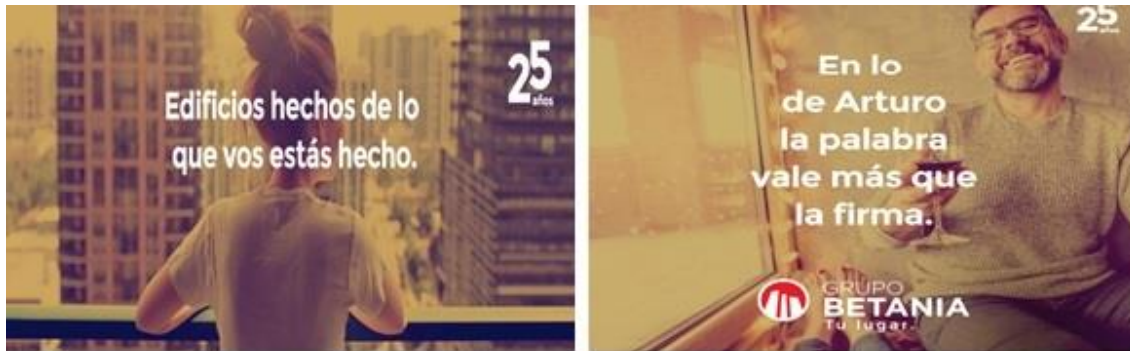
Campaña gráfica y virtual Betania, Abril 2016.

marcos de subjetividad actuales como “edificios hechos de lo que estás hecho vos”. Un ejemplo privilegiado de esta estrategia es la campaña publicitaria del Grupo Betania en su 25 aniversario.