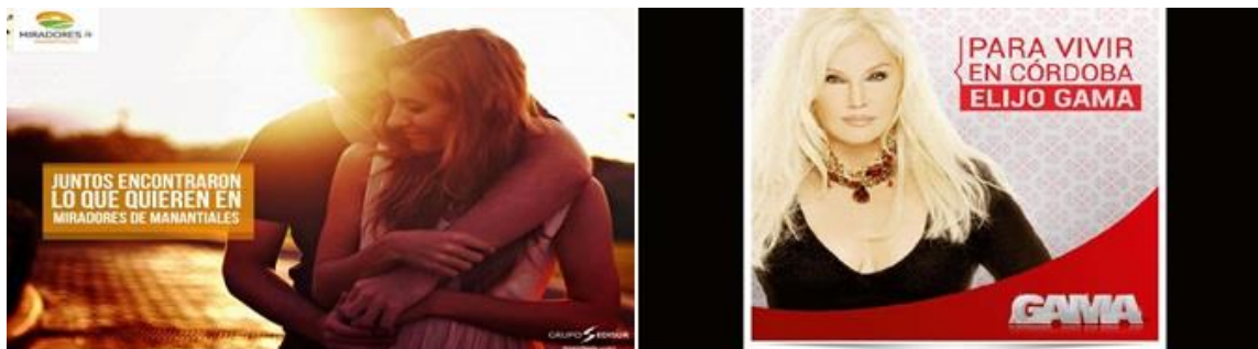
Publicidad Miradores de Manantiales, en página de Facebook Grupo Edisur 10/11/2014-Publicidad GAMA, gráfica y en la vía pública, años 2014 y 2015.

Aparte del segmento descrito, la oferta de proyectos habitacionales e inversión para la clase media se encuentra diferenciada desde distintas categorías sociales, como son fracciones de edad, parejas o familias, segmentos de aspiración de ascenso social (con el empleo de metáforas, la referencia a figuras populares reconocidas, etc.) lo que puede observarse a partir de estos dos ejemplos de imágenes a continuación.