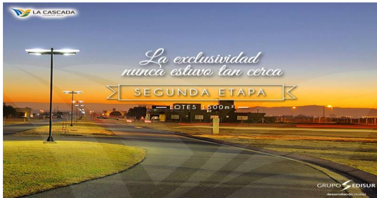
Publicidad “La Cascada Country Golf”, en página de Facebook Grupo Edisur 01/05/15.

significar la separación en el espacio urbano como distancia de la distinción de otros sectores en el espacio social, se plasman en varias publicidades: