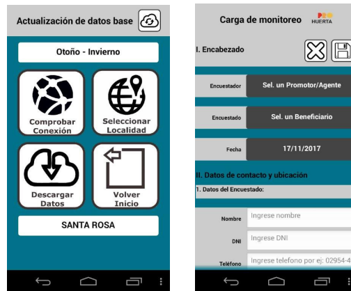
Fig. 1. Pantallas de ejemplo de la App de monitoreo

naciones de ProHuerta, Extensión, Proyectos Territoriales, directores, etc). La aplicación se ha utilizado exitosamente en la provincia de La Pampa durante los años 2017 y 2018. Está planificado extender su uso a la provincia de San Luis.