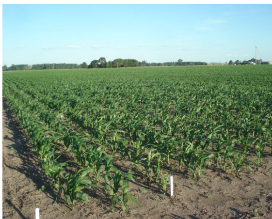
Figura 1: parcelas de ensayo en Pergamino

Nuestros estudios están dirigidos a dilucidar el efecto del ácido salicílico sobre el comportamiento de plantas de maíz inoculadas y no inoculadas con Fusarium spp, en condiciones de campo. Para lograr estos objetivos estudiamos el índice de verdor (SPAD), el contenido de proteínas solubles, el patrón proteico y los componentes del rendimiento. También se realizaron observaciones periódicas de la incidencia de plagas y enfermedades a lo largo de toda la experiencia