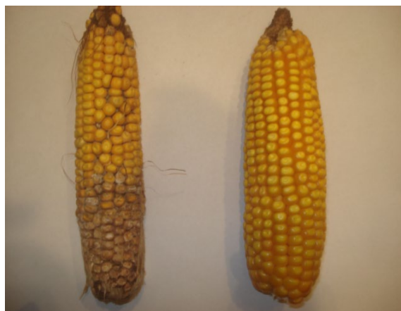
Figura 2: espiga de maíz infectada y sana

Los datos muestran que existen diferencias significativas en el contenido de proteínas solubles y el índice de verdor. El rendimiento, peso de mil granos y número de granos/m 2 disminuyeron significativamente en el tratamiento con Fusarium spp., mientras que no se modificó el peso de los marlos. El número de granos/m 2 fue el parámetro que mejor ajustó con el rendimiento ( R^2=0,86 ). El AS modificó el patrón proteico y contrarrestó el efecto del hongo sobre el rendimiento y sus componentes.