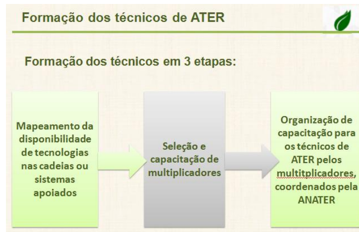
Figura 2. Concepção da ANATER sobre as etapas necessárias à capacitação dos técnicos de ATER.