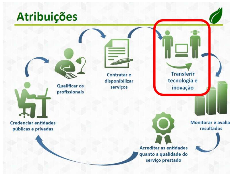
Figura 1. Atribuições previstas para a Agência Nacional de ATER. Fonte: BRASIL (2013).

Esse formato de capacitação dos técnicos é oriundo da metodologia Treino & Visita (T&V), amplamente difundida pela Embrapa como um recurso para que as tecnologias desenvolvidas na empresa sejam levadas até os agricultores. Segundo Domit et al. (2007) a pesquisa agropecuária brasileira já desenvolveu milhares de projetos, produziu conhecimentos e tecnologias, mas muitas vezes eles não são adotados pelos agricultores. Visando sanar essa lacuna foi adaptada para a realidade brasileira 11 a metodologia T&V, que consiste basicamente na formação e treinamento de técnicos multiplicadores cuja tarefa é formar e treinar grupos organizados de técnicos multiplicadores de campo (os técnicos de ATER, no caso) que, por sua vez, devem repassar as tecnologias para grupos organizados de produtores rurais.