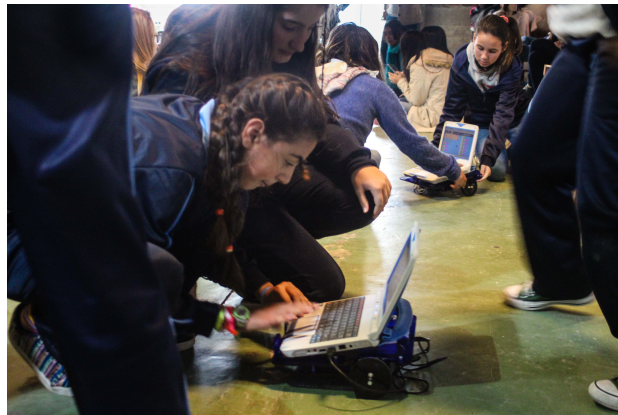
Fig. 2. Niñas realizando los desafíos en el robot Butiá

En la práctica se brindaron dos sub-talleres denominados: “Comunicación Láser” y “Robótica con Arduino”. El primero orientado a adolescentes de bachillerato y el segundo