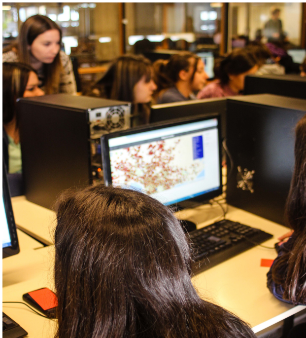
Fig. 4. Niñas realizando el taller Mapeá tu mundo

algunos grupos en donde la asistencia lo permitía varios docentes de secundaria realizaron también la propuesta práctica. En la Figura 4 se puede ver una imagen ilustrativa del trabajo en el taller.