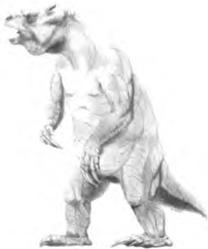
Fig. 2. El acusado, Megatherium americanum . Superando las 5 toneladas de masa corporal su tamaño corporal se compara al de un elefante actual. Tomado de Fariña (2002).

& Manera de Bianco, 1996), para postular que este perezoso habría sido un cazador activo o un cleptoparásito –es decir, que espartería a los carnívoros que habrían abatido una presa como suelen hacer las hienas y leones en la actualidad– (sin descartar que, además, hubiese ingerido también material vegetal). Por cierto, el de mayor tamaño conocido en la evolución de los mamíferos.