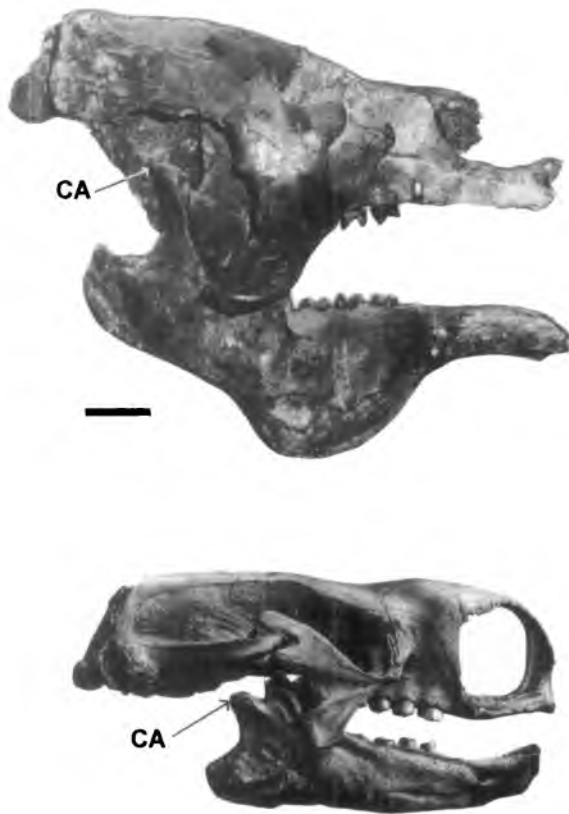
Fig. 4. Comparación del cráneo de Megatherium americanum y Mylodon (tomada de Reindhart, 1879). Siguiendo el modelo actualista, la posición del cóndilo articular (CA) indicaría que Megatherium americanum es un herbívoro y Mylodon un carnívoro. Sin embargo, un análisis funcional que incorpora la evolución del grupo propone un panorama diferente. Escala = 10 centímetros.