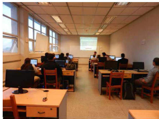
Taller práctico de programación de Accesibilidad Web