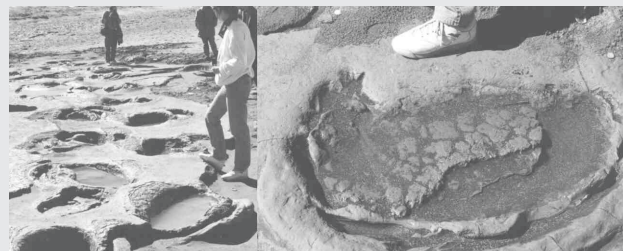
Fig. 3. Huellas fósiles en Pehuén-Có atribuibles a Megatherium .

En efecto, se trata de un animal al menos ocasionalmente bípedo, es decir, un mamífero que no tiene sus extremidades an-