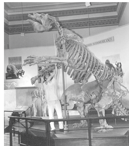
Fig. 2. Uno de los dos esqueletos de Megatherium americanum en exhibición en el Museo de La Plata.

Sus restos arribaron al Real Gabinete de Historia Natural de