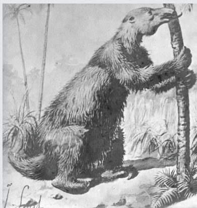
Fig. 4. Una reconstrucción tradicional de Megatherium americanum de fines del siglo XIX. Nótese la larga lengua y lo inadecuado del ambiente con palmeras y helechos.

En el caso del megaterio, podemos saber de sus seguramente extraños hábitos a través de una multitud de enfoques diferentes. Por ejemplo, en Pehuén-Có, sudeste de la provincia de Buenos Aires, cuando las sudestadas barren la arena de la playa, quedan al descubierto huellas en el sedimento subyacente que tienen forma groseramente semioval y un tamaño que haría imposible la compra de calzado apropiado: 90 cm de largo, 40 de ancho y 25 de profundidad. Estas huellas, casi exclusivamente las de las patas traseras, son las que hacen concluir que el megaterio era el mamífero bípedo más grande que se conoce, a veces se disponen en rastrilladas de hasta 36 unidades (Fig. 3). Utilizando la Física, que se aplica tanto a la materia inanimada como a los seres vivos como ya nos advirtió el propio Galileo, y utilizando nuestros conocimientos sobre la distancia entre las pisadas y la velocidad a la que se mueve un mamífero moderno, podemos saber que el gran perezoso era grande, sí, pero no tan perezoso, porque iba a una