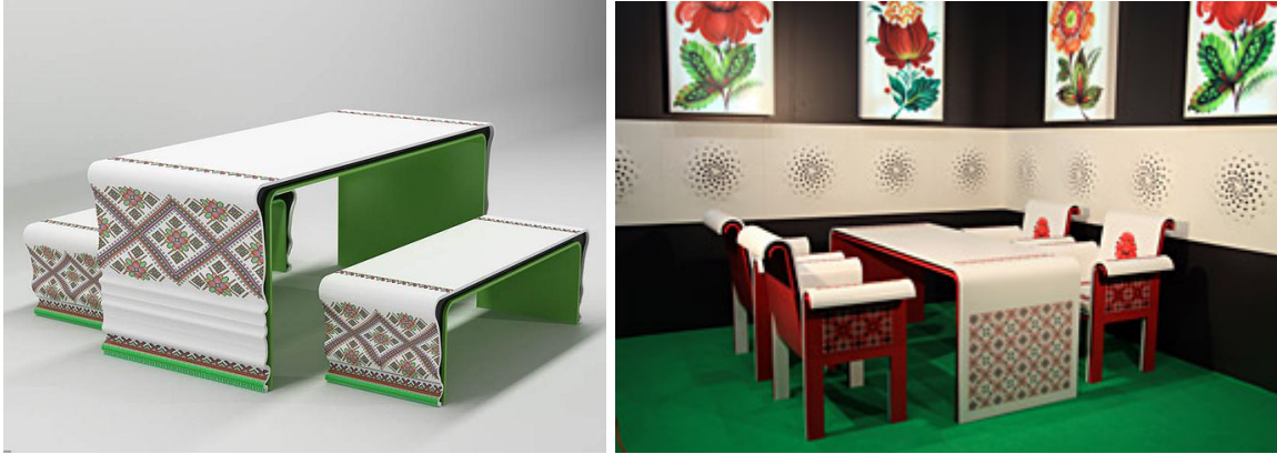
Рис.3. Проект «Українські візерунки», Галант Я., 2012 р.

Як приклад використання ігрового принципу постмодернізму можна навести і урбаністичну скульптуру, яка в естетиці постмодернізму, стала оживляти міське середовище майже повсюдно. Сама по собі «доступність», відсутність дистанції між арт-об'єктом і глядачем запрошує до контакту, залучає до ігрового простору. Це викликано і тим, що у сучасної людини виникла потреба не тільки пізнати світ, але й затвердити в ньому себе всіма своїми почуттями, проявити всі свої творчі сили. Прикладом формування ігрового простору в Києві є Пейзажна алея.