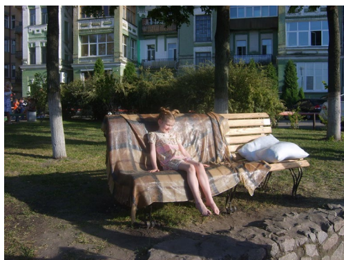
Рис. 6. «Неначе вдома», В. Кузнецов, 2009 р.