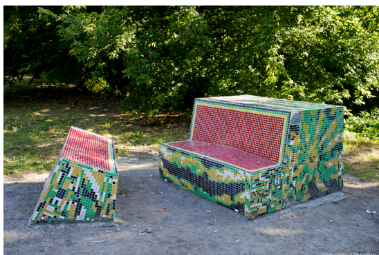
Рис. 4. «Кавун», К.Скригуцький, 2009р.

«На даху» – це скульптура дизайнера Олександра Залевського. Образ витвору-дах будинку, на якому можна сидіти як на лавці. Ця скульптура пропонує уявити себе на даху будинку, дивлячись на пейзажі, що розкриваються перед поглядом (рис. 7).