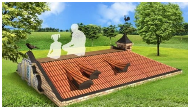
Рис. 7. «На даху» О.Залевський, 2009 р.

Висновки: При дослідженні ігрового принципу художньої культури постмодернізму було виявлено, що він проявляється насамперед у свідомій установці творця на інтелектуальну гру з читачем. Ігровий принцип постмодернізму відрізняється терпимістю до суперечностей, залученням глядача в гру, багатозначністю образів, свободою у поводженні з історичними запозиченнями, використанням парадоксів і гротеску, іронії та сарказму як виразних прийомів.