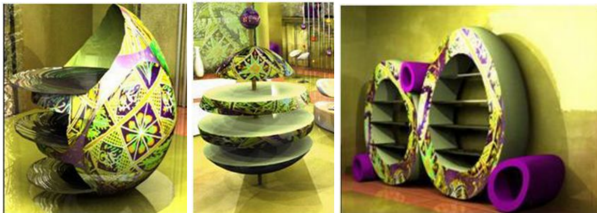
Рис. 1. Робота «Використання геометрії при створенні національно-дентифікаційного інтер'єру в українському стилі», Клейн С. 2010р.

Ще одним прикладом є інтер'єр молочного кафе студентки Національного авіаційного університету Соломенко Анни (рис. 2). У даному інтер'єрі використаний образ молочної ферми і звідти запозичені елементи. Так люстра має образ дійного апарату, а столи виконані як годівниці з сіном для корів. Барна стійка є елементами збитого з дошок хліву з додаванням сіна. На стінах інтер'єру зображення етикеток молочної продукції. В цілому інтер'єр несе іронію та гру з глядачем, що характерне для постмодернізму.