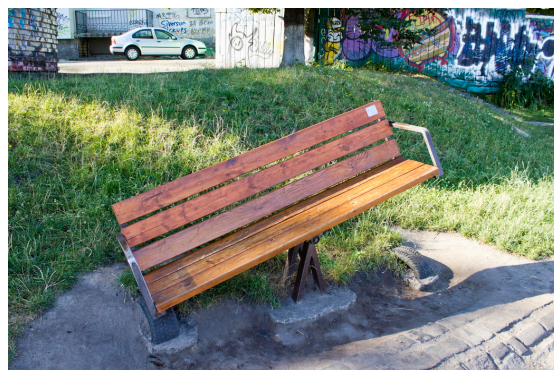
Рис. 5. «Баланс», Андре Тан, 2009 р.