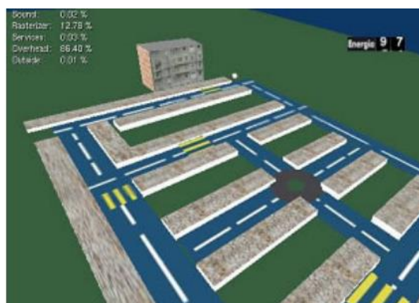
Figura 10. Vista superior do jogo Educa Trans.

Inicialmente o jogador escolhe se irá atuar como pedestre, ciclista ou motorista. Todos eles iniciam a sua trajetória num mesmo ponto e necessitam atingir o mesmo destino no menor tempo e com o menor risco à sobrevivência. O objetivo é chegar ao destino com o máximo de energia e o mínimo de tempo para conquistar o tesouro. Em sua trajetória o usuário interage com diferentes vias, sinalizações de trânsito, pedestres, ciclistas e automóveis (Figuras 10 e 11).