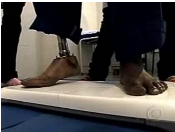
Figura 8. Manipulação do jogo através de movimentos

Portanto, é possível visualizar que, na arquitetura, a experiência estética tem sido utilizada através de formas que possibilitam aos usuários sensações e percepções que rompem com o tradicional. Na arte, tem sido mais comumente aplicada através de instalações onde o público passa de observador a interator. Na área da saúde tem sido forte aliada a tratamentos fisioterápicos, onde jogos digitais possibilitam que paciente exercitem músculos, motricidade e coordenação de forma lúdica, divertida e eficaz, numa integração entre corpo e mente. Seguindo esse contexto, esta pesquisa visualiza uma possibilidade ainda pouco explorada na educação: a combinação da abordagem artística da experiência estética com objetivos educacionais; sem depender necessariamente de modernos softwares de simulação. O objetivo é permitir que o aluno transforme-se em interator e encontre espaço para elaborar estratégias de ação e testar a aplicação de hipóteses, construindo efeitos de sentido para o objeto de estudo. É o que eu será abordado na subseção a seguir.