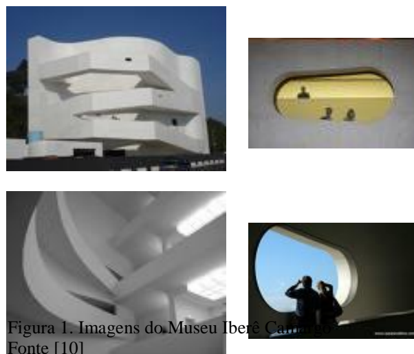
Figura 1. Imagens do Museu Iberê Camargo. Fonte [10]

Porto Alegre. O próprio prédio é uma obra de arte, causando sensações e formando espaços significativos a cada recanto – interatividade entre indivíduo/signos/bagagem cultural de cada sujeito. Transitar pelo museu deixa de significar apenas uma ação de ir e vir, para designar uma ação consciente através de experimentações sensíveis.