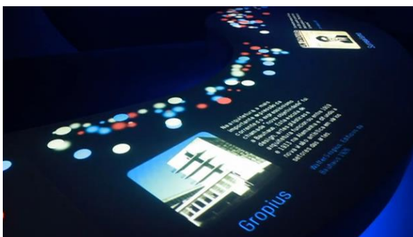
Figura 4. Sala do Modernismo

Na Sala Rupestre (Figuras 5 e 6) o visitante percorre uma caverna dotada de pinturas rupestres. Ao tocá-las surge uma animação mostrando as pinturas em movimento e informações a respeito. A prática ocorre através de sensores eletrônicos e animações interativas. Mais uma vez observa-se a preocupação com uma ambientação diferenciada que permite a imersão do sujeito no tema abordado.