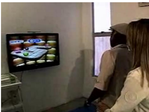
Figura 7. Utilização de jogo na prática da fisioterapia