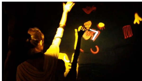
Figura 5. Sala Rupestre

Na Sala Rupestre (Figuras 5 e 6) o visitante percorre uma caverna dotada de pinturas rupestres. Ao tocá-las surge uma animação mostrando as pinturas em movimento e informações a respeito. A prática ocorre através de sensores eletrônicos e animações interativas. Mais uma vez observa-se a preocupação com uma ambientação diferenciada que permite a imersão do sujeito no tema abordado.