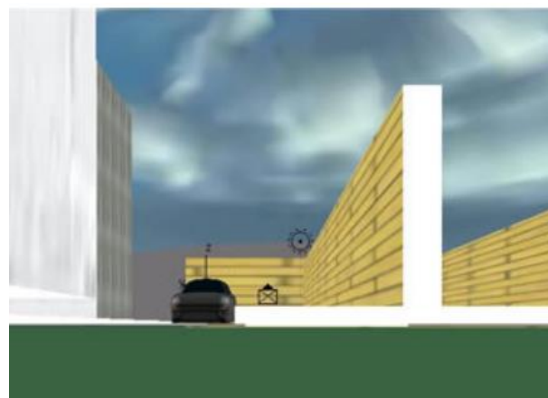
Figura 11. Vista 3D do jogo Educa Trans

O jogo possibilita a experiência estética ao usuário uma vez que o transporta para um espaço onde, por um