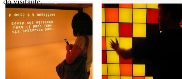
Figura 2. TIM Festival. Fonte [11]

Inicialmente as experiências possuíam um caráter mais reativo, como nos exemplos a seguir (figura 2). Na instalação da esquerda, usuários situados em distintos pontos da cidade podiam enviar mensagens para o telão do TIM Festival. Na direita, os pixels eram acesos ou apagados a partir do movimento dos braços do visitante.