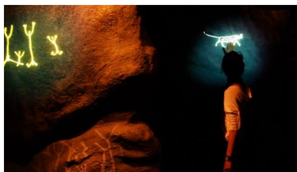
Figura 6. Sala Rupestre

Recentemente a experiência estética está sendo aplicada a tratamentos fisioterápicos. Foi a forma encontrada por profissionais da saúde para tentar diminuir o abandono de tratamento por pacientes que acabavam não suportando o longo processo de sua reabilitação. Dessa forma, segundo os fisioterapeutas, os pacientes encontram motivação para retornar e continuar o tratamento.