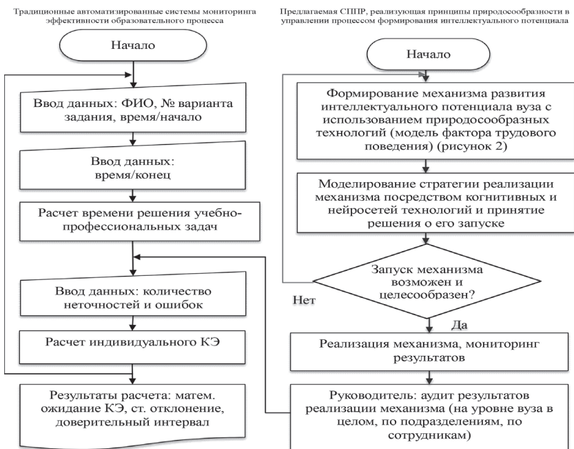
Рис. 3. Алгоритм расчета коэффициентов эффективности формирования интеллектуального потенциала в вузе

Основными требованиями при проектировании информационной системы выступали: