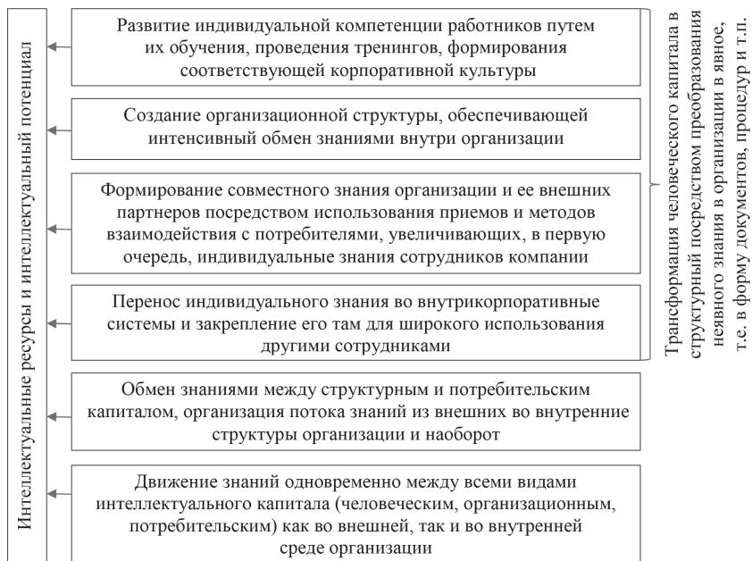
Рис. 1. Стратегии управления интеллектуальным потенциалом [10, с. 131–136; 11]

питала и актуальности составляющих его знаний с целью их обновления на качественно новом уровне.