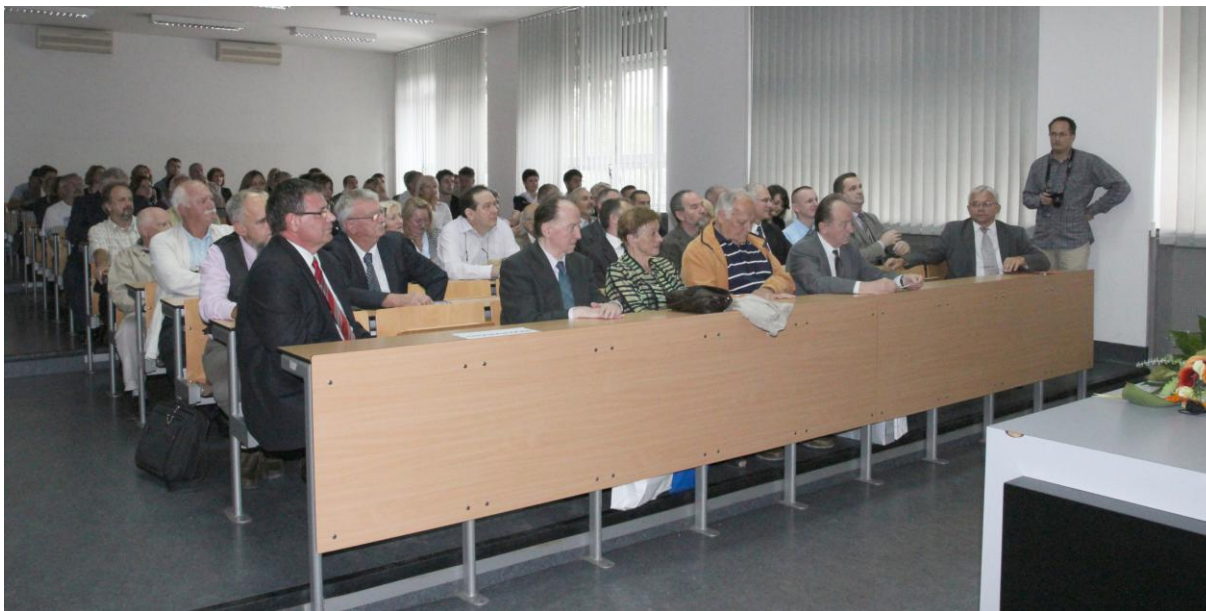
Figure 2. Working part of the scientific colloquium

Slika 2. Radni dio znanstvenog kolokvija.