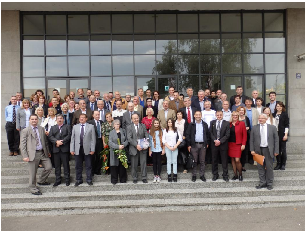
Figure 6. Participants of the scientific colloquium Slika 6. Sudionici znanstvenog kolokvija