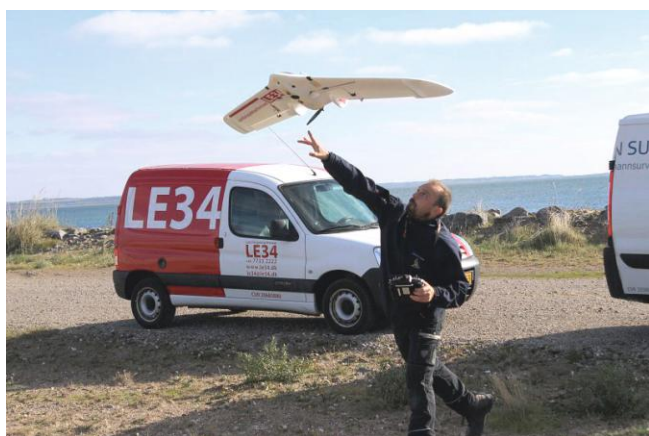
Presentation of geodetic survey field work in LE34 company Prikaz terenskog rada geodeta u tvrtki LE34

The second educational journey, attended by students of the Faculty of Geodesy, University of Zagreb, lasted from October 10 to October 17, 2016. Forty-nine students visited three cities in Germany and one in Denmark during the journey.