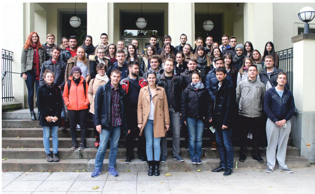
Students of the Faculty of Geodesy of the University of Zagreb in front of the Archenhold Observatory Sudenti Geodetskog fakulteta Sveučilišta u Zagrebu ispred zvjezdarnice Archenhold

U glavnom gradu Danske Kopenhagenu posjetili smo više institucija među kojima je i COWI, jedna od najve-