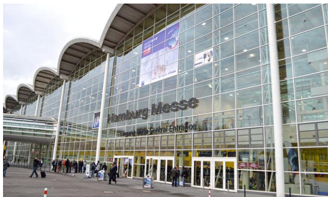
The entrance to the Intergeo fair 2016 in Hamburg Ulaz u Intergeo 2016. u Hamburgu