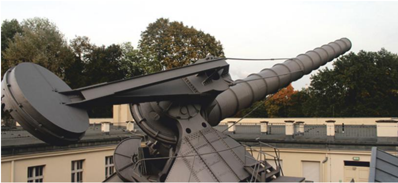
The longest mobile telescope located in the Archenhold observatory Najdulji pokretni teleskop na Zemlji, smješten u opservatoriju Archenhold

Archenhold Observatory in Berlin about the museum of the observatory and the longest moveable refractive telescope on Earth. The telescope is 21 meters long and can be used to observe stars, but only when the sky is clear, with no clouds to obscure vision. Other attractions in the Archenhold Observatory include the historic Einstein's room, a small Zeiss planetarium and giant metallic meteorites.