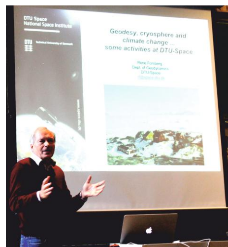
Lecture given by Prof. René Forsberg at DTU Space

Istaknuo bih da je tijekom ovog putovanja svaki student mogao otkriti značaj i veličinu geodezije i geoinformatike. Čak i u nekim područjima znanosti gdje to najmanje očekujemo krije se geodetska struka kao jedna od vodećih. Takva su putovanja odličan temelj za razmjenu znanja, upoznavanje s europskim standardima i otkrivanje mogućnosti rada u struci nakon završenog obrazovanja. Geodezija