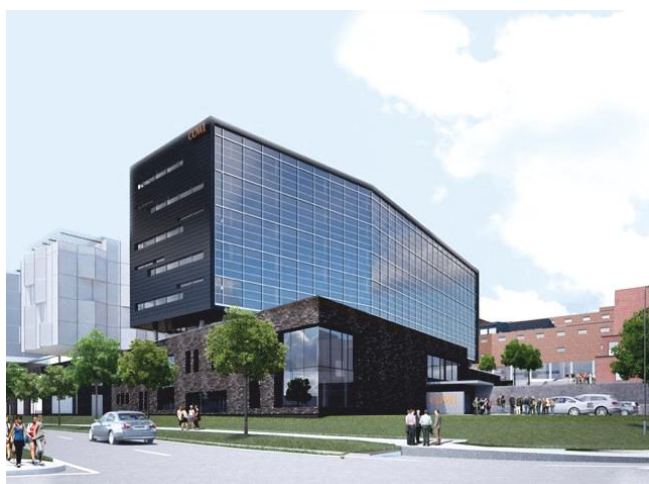
The headquarters of the COWI company in Copenhagen Sjedište tvrtke COWI u Kopenhagu