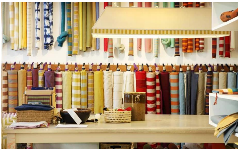
L'interno del negozio in via G. G. Mora.

Colore. Il tessuto tinto in filo è proposto in una grande varietà di colori brillanti e combinazioni di righe e tinta unita.