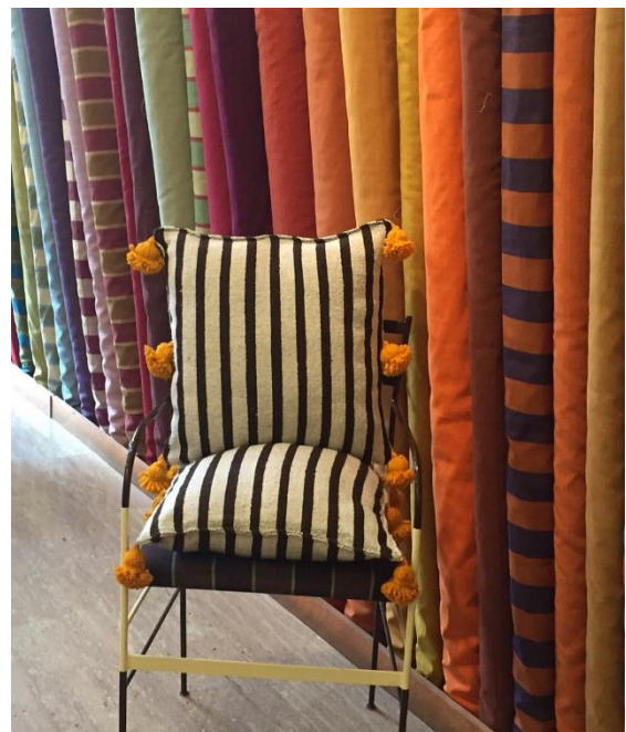
Arredo per la casa Tessuti Mimma Gini.

In futuro ci piacerebbe, comunque, poter riattivare la produzione della collezione di tessuti per la casa, con l'idea di rivolgerci anche ai piccoli produttori italiani.