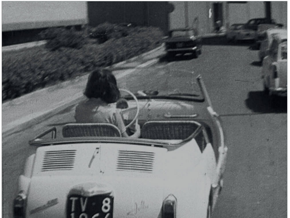
Fig. 1 - Fotogramma tratto da "Bellissime 2" (2006) di Giovanna Gagliardo.