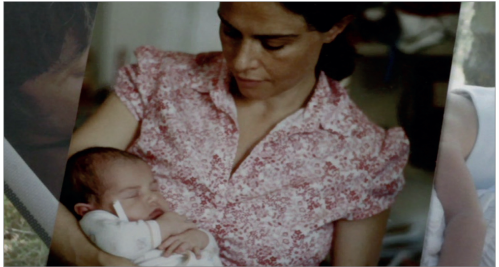
Fig. 3 - Fotogramma tratto da "Tutto parla di te" (2012) di Alina Marazzi.

anche le rose , di aver provato a interrogare fonti meno abusate e istituzionali, cercando immagini che potessero «break the conventional representation of the 1970s [...] to understand what was happening in the home and other places where women were beginning to meet collectively» 36 . È questo il senso del recupero, ad esempio, di alcuni film sperimentali di Alberto Grifi, Mario Masini e Adriana Monti in Vogliamo anche le rose . Così come negli altri materiali utilizzati, i frammenti vengono inseriti senza dimenticare mai di rispettare la loro componente storica, la logica di creazione delle immagini e la loro originale motivazione, articolando una particolare «ethics of found footage» 37 . In questa logica si passa dal diario, dispositivo intimo per eccellenza, alle immagini di archivio, «per cogliere il più possibile tutta la verità emotiva ed esistenziale di cui la storia è fatta» 38 , o si intrecciano fotografie della propria famiglia in un discorso ampio sulla maternità, come avviene in Tutto parla di te (fig. 3). Una procedura di riflessione sul femminile analoga alle pratiche riprese dal cinema delle donne, a partire dalle tecniche dell'autocoscienza, «forma primaria della politica femminista» 39 , in cui si partiva dalla condivisione dell'esperienza personale per formare una coscienza collettiva. Siamo quindi di fronte a