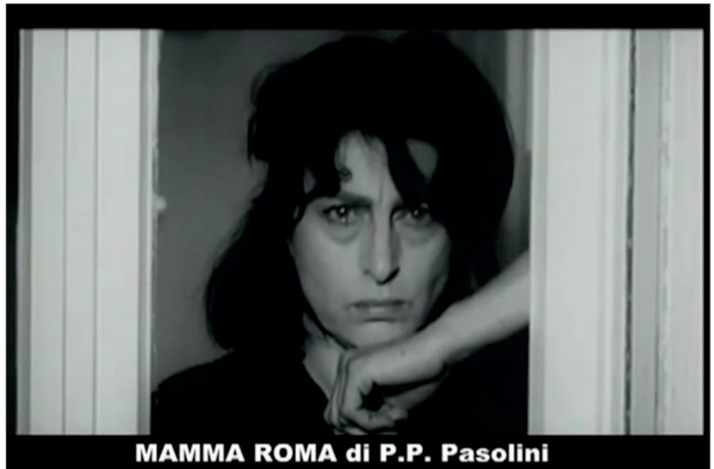
Fig. 2 - Fotogramma tratto da "Il corpo delle donne" (2009) di Lorella Zanardo, Marco Malfi Chindemi e Cesare Cantù.

significato particolare all'interno di un processo storico-politico più ampio 31 . Allo stesso modo, continuano Gribaldo e Zapperi, se da un lato Il corpo delle donne oppone resistenza rispetto a certi modelli culturali e a ruoli di genere, il rischio cui il film va incontro – espresso soprattutto dalle parole della voce che raccorda le immagini e struttura la narrazione – è quello di contrapporre un'autenticità del femminile al governo artificiale dell'immagine. Il primo piano di Maria Callas che guarda in macchina pare interpellare gli spettatori: inizialmente alternato in ritmo rapidissimo ai volti delle protagoniste televisive, rimane poi a lungo sullo schermo, mentre la voce over enuncia la differenza tra volto espressivo, «composito» e asimmetrico, e volto statico, o «tipico» 32 . Al volto statico delle donne sottoposte alla chirurgia estetica pare anteporsi in questo senso l'immagine simbolica di una donna ugualmente tipizzata nella fissità di un'univoca identità di genere che la imprigiona «in un' impasse dalla quale non c'è possibilità di fuga» 33 . In questa prospettiva la forza del film sarebbe quella di dare la possibilità di leggere fra le immagini proposte nel «montaggio di scene di ordinaria umiliazione» delle trasmissioni televisive, in modo da rifuggire da una logica binaria «secondo cui l'artificialità dell'immagine viene demonizzata in quanto opposta ad un reale pensato come salvifico» 34 . Sono le immagini a poter svelare ciò che la narrazione non dice.