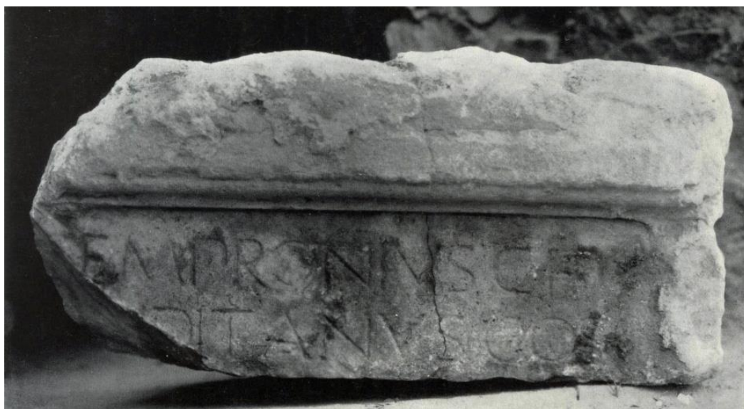
Fig. 3. Il frammento duinate del console Gaio Sempronio Tuditano (da Imagines 148).