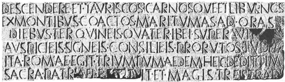
Fig. 5. Ricostruzione digitale del titulus trionfale sulla base dei supplementi del Bücheler e dell'integrazione auspicieis .