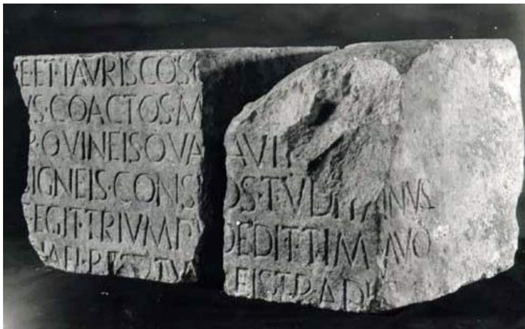
Fig. 2. L'iscrizione trionfale di C. Sempronius Tuditanus (da Imagines 147).