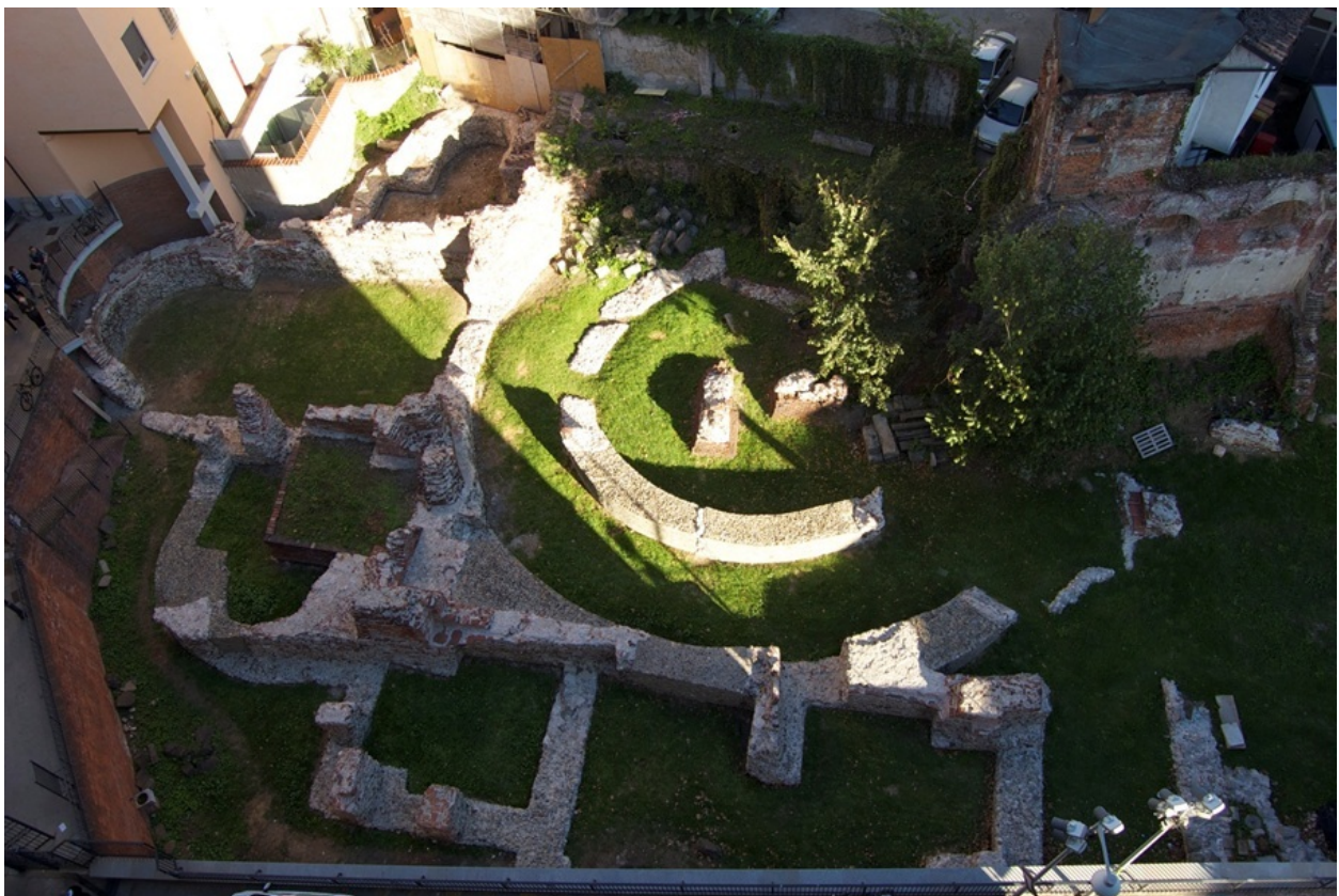
Fig. 2. Milano, via Brisa. Area archeologica del Palazzo imperiale.