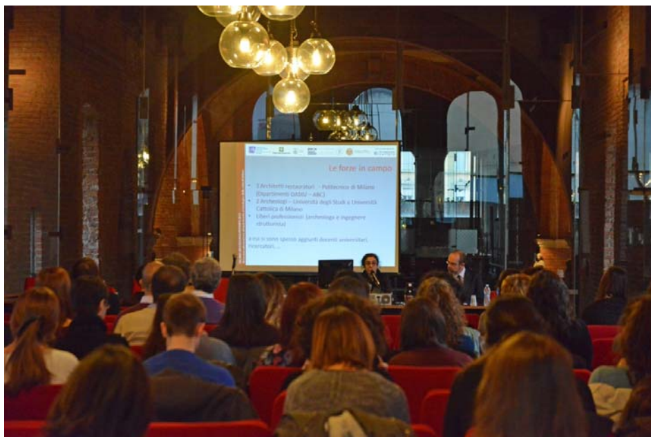
Fig. 8. Milano, Seminario "Milano Archeologia".

Monica Abbiati monica_abbiati@regione.lombardia.it