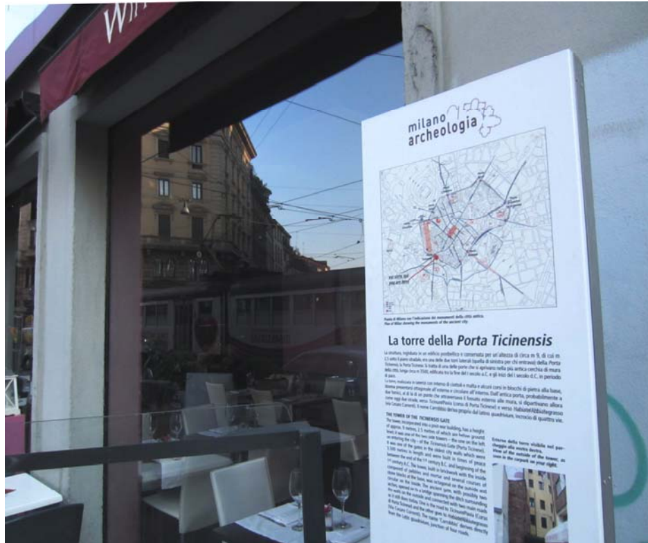
Fig. 7. Milano, largo Carrobbio. Pannello didattico.