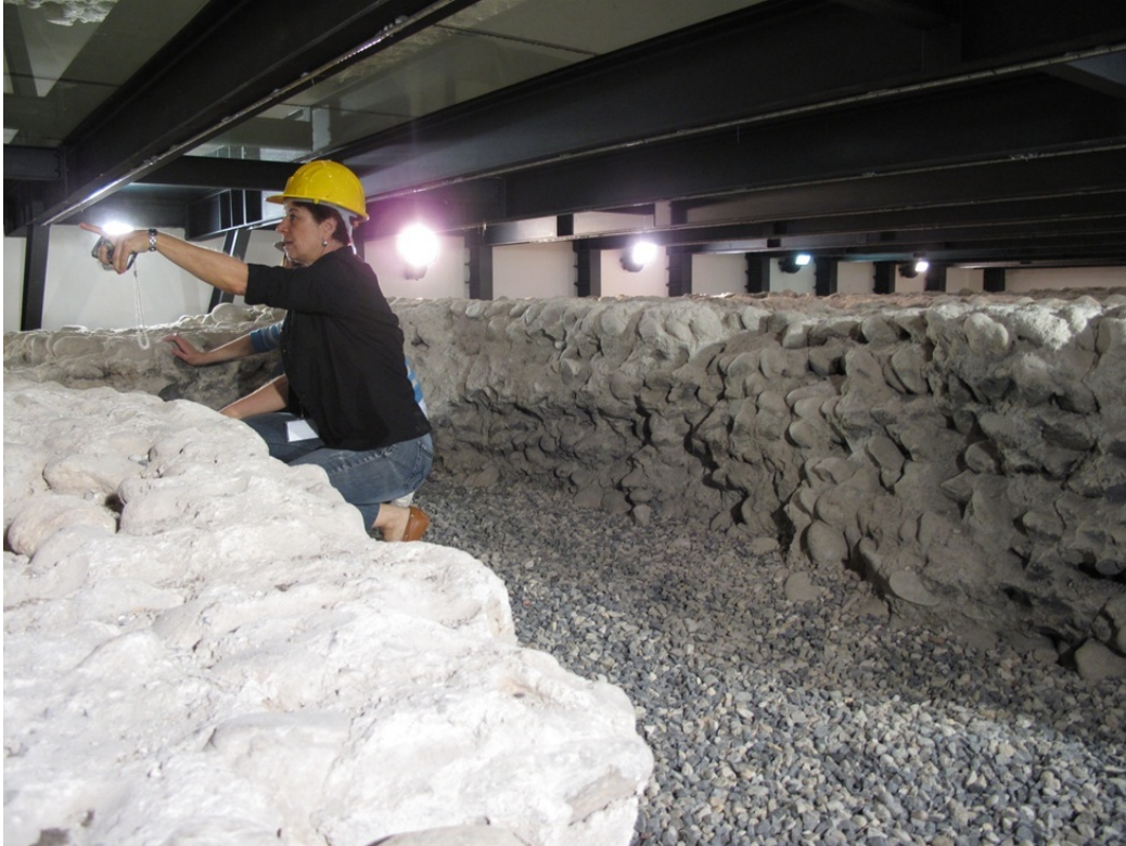
Fig. 3. Milano, piazza Affari. Visita ispettiva ai resti del teatro romano.