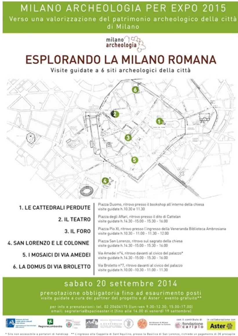
Fig. 5. Locandina delle visite guidate ad alcune aree archeologiche milanesi, organizzate in occasione delle Giornate Europee del Patrimonio (20 settembre 2014).