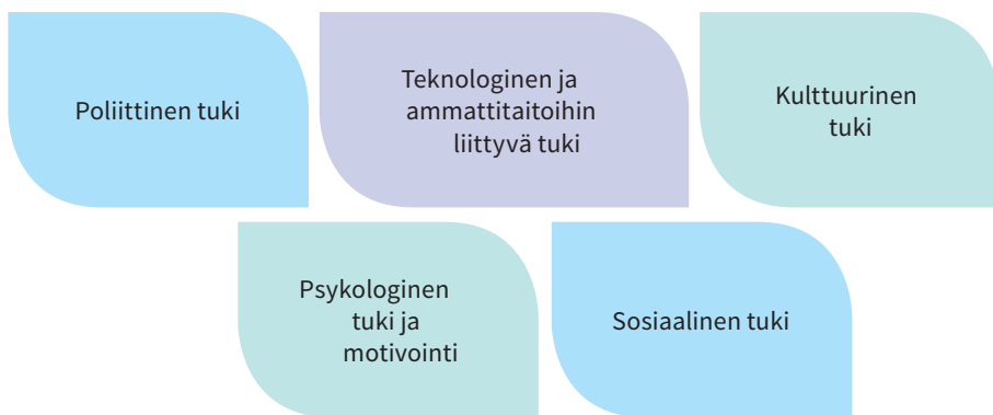
KAAVIO 4: HAASTATTELUISSA ESIIN NOUSSEET TUEN TARPEET

Vuorovaikutusta paikallisen kantaväestön ja tänne muuttavien välillä tulee lisätä, jotta kynnyks työllistymiseen olisi maahanmuuttajille mahdollisimman matala. Vaikka avointa rasismia Lapissa kohtaa harvoin, eikä maahanmuuttokysymys ole ainakaan vielä hallinnut julkista keskustelua, on yleisessä asenneilmapiirissä parantamisen varaa. Parhaiden yrittäjyyden tukikäytäntöjen kartoituksen, ryhmäkeskusteluiden ja yrittäjähaastatteluiden pohjalta esitämme muutamia tukimuotoja joilla maahanmuuttajien yrittäjyyttä voisi edistää Rovaniemellä ja Meri-Lapin alueella. Maahanmuuttajien tarvitsemat tukimuodot ovat: