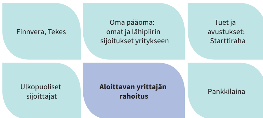
KAAVIO 2: ALOITTAVAN YRITTÄJÄN RAHOITUSMAHDOLLISUUKSIA

Rahoituksen hankkiminen uudelle yritykselle on haaste, joka mietityttää niin kantasuomalaisia kuin maahanmuuttajiaakin. Maahanmuuttajille ei ole tarjolla mitään erityistä lisätukea, vaan yritystoimintaa tuetaan samoin ehdoin, mihin myös muut suomalaiset yrittäjät ovat oikeutettuja (ks. kaavio alla).