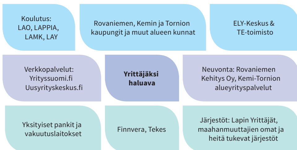
KAAVIO 1: YRITTÄJYYDESTÄ KIINNOSTUNEEN YHTEISTYÖTAHOJA ROVANIEMEN JA MERI-LAPIN ALUEELLA

Yrittäjyydestä kiinnostuneille tarjolla olevan tuen voi jakaa kolmeen pääryhmään: 1) koulutus, 2) neuvonta ja 3) rahoitus ja muut tukitoimet. Esittelemme alla muutamien esimerkkien kautta näitä tukimuotoja. Alla olevassa kaaviossa on esitetty yrittäjyydestä kiinnostuneen keskeisiä yhteistyötahoja.