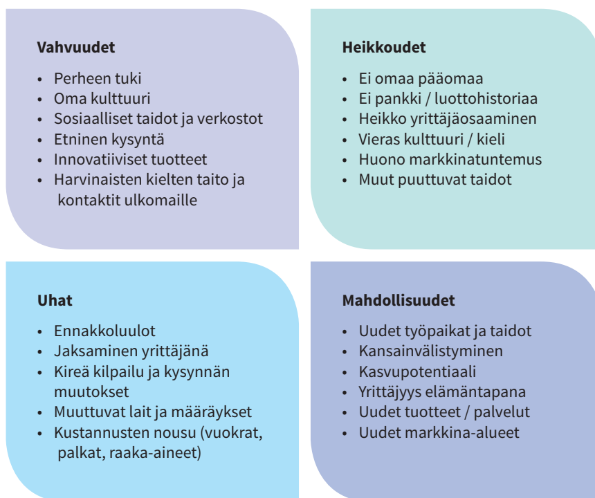
KAAVIO 3: MAAHANMUUTTAJAYRITTÄJÄN VAHVUUDET, HEIKKOUEDET, UHAT JA MAHDOLLISUUDET

Yritystoiminta olisi hyvä aloittaa pienellä pääomalla ja pienellä riskillä ja laajentaa yritystä oman osaamisen ja markkinatuntemuksen lisääntyessä. Mikäli yrityksen pyörittämiseen liittyvät taidot ovat puutteelliset, voi esimerkiksi kirjanpitolain vaatimusten tai arvonlisäverotuskäytännön ymmärtäminen olla haastavaa. Mikäli pienyrittäjä ajautuu vaikeuksiin, voivat maksamattomat velat, maksut ja verot aiheuttaa taloudellisten tappioiden lisäksi maksuhäiriömerkinnän myös kaikille yritystoiminnassa mukana oleville perheenjäsenille. Alla olevaan kaavioon on koottu vahvuuksia, heikkouksia, uhkia ja mahdollisuuksia, jotka liittyvät maahanmuuttajayrittäjyyteen.