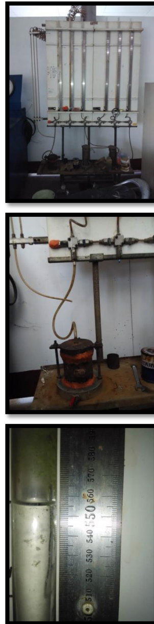
Gambar 2. Uji permeabilitas

Permeabilitas adalah kemampuan mortar meneruskan air melalui porinya. Pemeriksaan koefisien permeabilitas mortar dilakukan dengan menggunakan alat Falling Head Permeameter . Berikut ini adalah hasil pemeriksaan koefisien permeabilitas tanah.