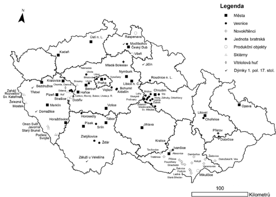
Mapa 3. Mapa městských horizontů, vsí, novokřtěneckých areálů a lokalit spjatých s Jednotou bratrskou, skláren, specifických výrobních zařízení, vitriolových hutí a nálezů dýmek z 1. poloviny 17. století. © M. Preusz. Karte 3. Karte mit den Horizonten von Städten, Dörfern, mit den Böhmischem Brüdern verbundenen Wiedertäuferarealen und Fundstellen, von Glashütten, speziellen Produktionsanlagen, Vitriolhütten und Pfeifenfunden aus der ersten Hälfte des 17. Jahrhunderts. © M. Preusz.

sobě uloženy ostruhy a rapír vyrobený mezi lety 1600 až 1630 (Codreanu-Windauer 1988, 150; 1993/1994, 285). V kontextu pohřbů známých osobností lze upozornit na ještě nevyhodnocený průzkum hrobky Jana Jiřího ze Švamberka v Poběžovicích, který proběhl 26. června 2018. 2