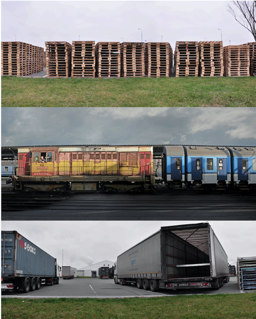
Fotografie s cyklu «Cizorodost» Sergey Lelyukh