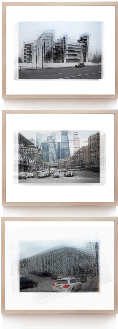
fotografie z cyklu «intervence» Sergey Lelyukh