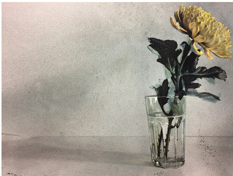
Zátíší Sergey Lelyukh 2018