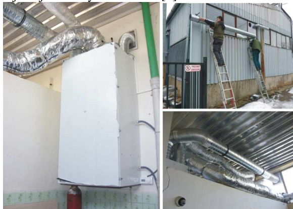
Obr. 5: Vzduchotechnická jednotka a jej inštalácia

Riadiaca jednotka nastavená na náš systém, resp. podmienky využitia, umožňuje pracovať v dvoch okruhoch, kde prvý vháňa teplý vzduch do interiéru dielni. Naopak druhý okruh slúži iba na meranie skúmaných veličín, teda vzduch je bez využitia vypúšťaný cez vyúst'ovaciu rúru do exteriéru. Uvedené spôsoby meraní a získavania dát umožňujú nezávislé porovnanie meraných veličín nielen v samotnom vzduchotechnickom systéme, ale aj v jeho jednotlivých úsekoch. [8]