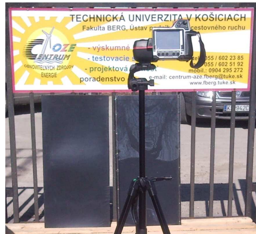
Obr. 6: Príprava meraní prvých prototypov SVK

Prvé dva prototypy boli v prvej fáze testované na nárast teploty vzduchu v závislosti na čase pri rovnakých slnečných podmienkach meraných článkom SMA1 [9].