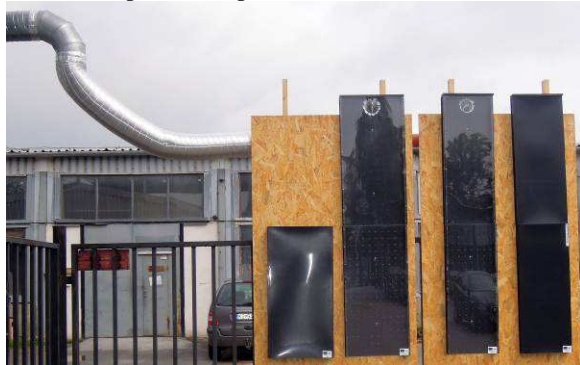
Obr. 4: Príprava prototypov SVK na merania so vzduchotechnickým systémom

ohriateho vzduchu z kolektorov je realizovaný pozinkovanými rúrami a izolovanými flexi hadicami kruhového prierezu s priemerom 20 a 25 cm.