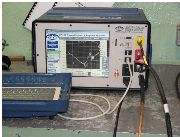
Obr.1 Merací systém DOBLE M5100

V tejto časti článku uvádzame výsledky z merania distribučného trojfázového transformátora 1000 kVA, 22/0,4 kV prostredníctvom meracieho systému DOBLE M5100 (obr.1).