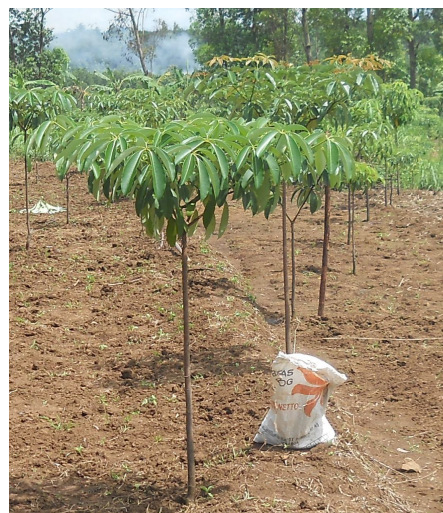
Gambar 2. Tanaman pulau darat umur 12 bulan di Wonogiri Figure 2. Alstonia angustiloba plantation at 12 months in Wonogiri

umur sama di Lubuk Linggau, Musi Rawas, Sumatera Selatan yaitu dengan rata-rata tinggi 0,91 m dan rata-rata diameter batang 1,98 cm (Muslimin dan Lukman, 2006). Kondisi tanaman pulau darat umur 12 bulan di KHDTK Wonogiri dapat dilihat pada Gambar 2.