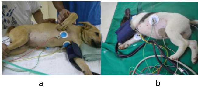
Gambar 2. Posisi alat perekam parameter penelitian. A. Anjing dewasa; B. Anjing anak.

Nilai EKG yang diperoleh dalam bentuk grafis rekaman kemudian dianalisis. Pada anjing dewasa, analisis grafis rekaman dilakukan dua kali pada sadapan II dengan selang waktu lima menit. Namun pada anjing anak, analisis dilakukan pada sadapan I, II dan III sebanyak dua kali dengan selang waktu lima menit. Hasil printing setiap gambar elektrokardiogram yang telah didapatkan, diukur nilai parameternya secara manual. Posisi alat perekam (elektroda) parameter secara keseluruhan pada tubuh anjing dapat dilihat pada Gambar 2.