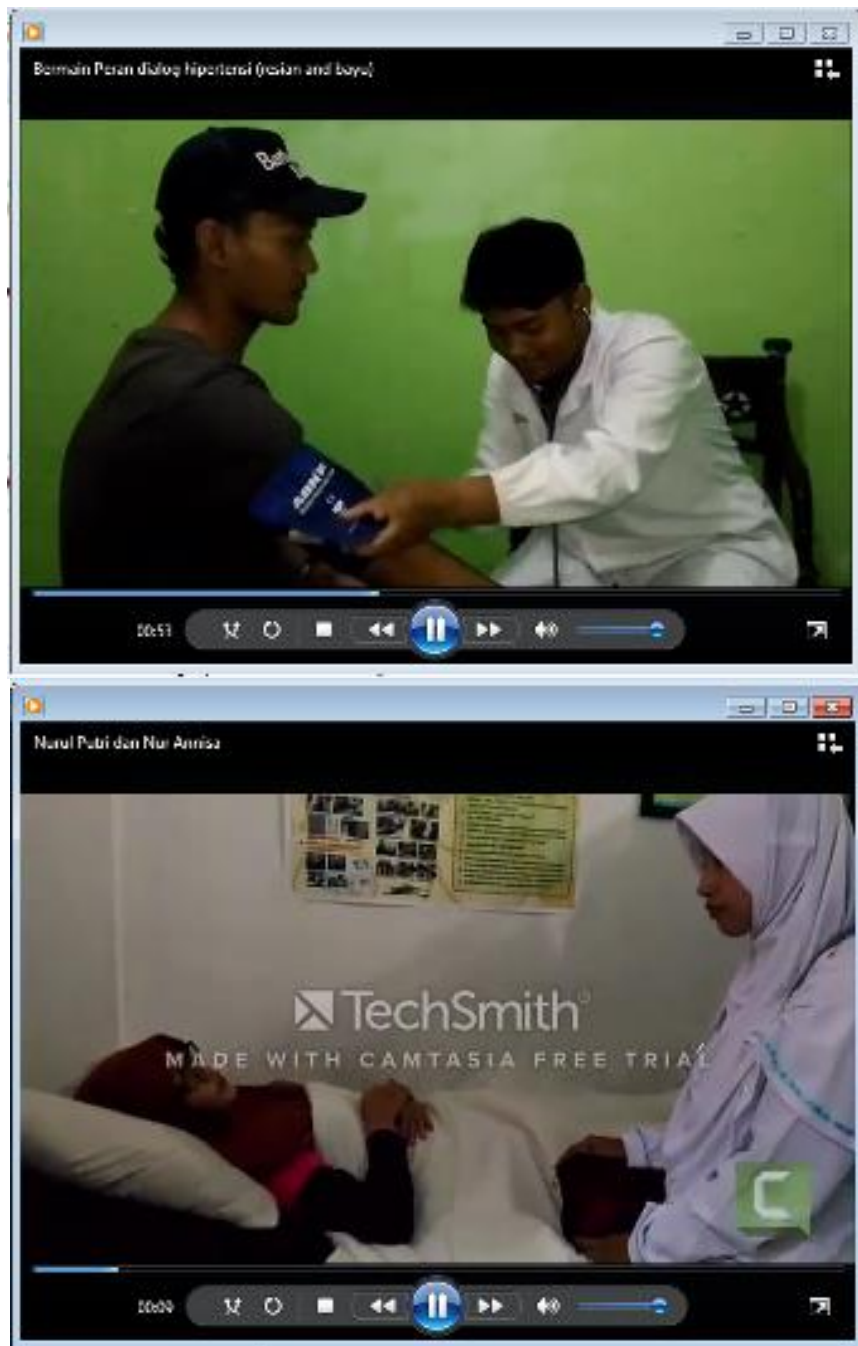
Gambar 3 dan 4. Aktivitas siswa berbasis initiative , confidence dan organizational awareness dalam mempraktekan percakapan dalam Bahasa Inggris.