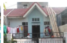
Tabel 3. Jangkauan cahaya pada RSS di Bekasi