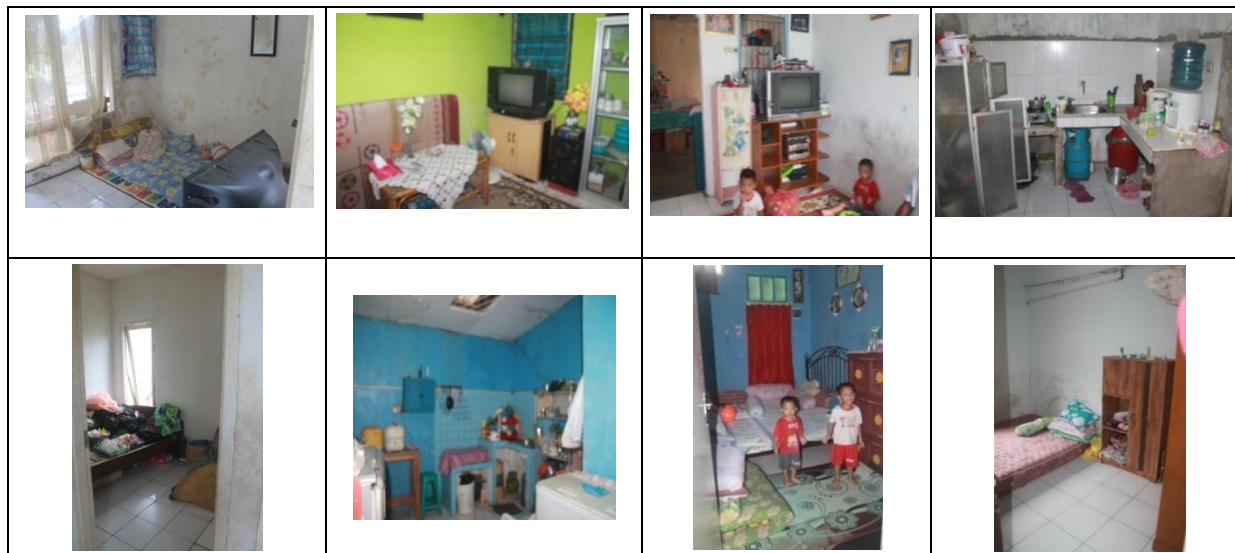
Gambar 1. Pencahayaan dan Bukaan pada RSS di Bekasi

Nurwulandari [4] menyatakan bahwa lubang cahaya ideal adalah 20% dari luas ruang. Menurut Pedoman Umum Rumah Sederhana Sehat, lubang cahaya minimum adalah persepuluh (1/10) dari luas lantai ruangan [1]. Sedangkan lubang penghawaan minimal 5% dari luas lantai.