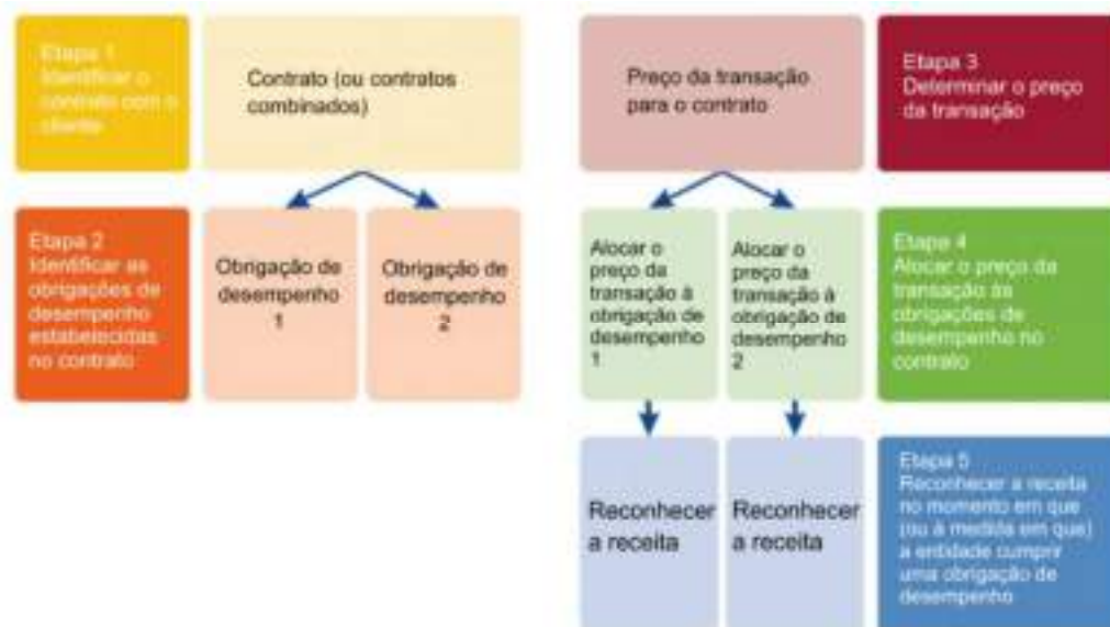
FIGURA 1 – Fluxograma de aplicação do modelo de 5 etapas.

Pirola et al. ( 2016, pg: 5) ressalta que a essência da IFRS 15 é propor um modelo que possa ser aplicado nos diversos segmentos de mercado, não se limitando ao reconhecimento das receitas, mas também na determinação do preço e em sua alocação quanto às obrigações de desempenho do contrato. O modelo conceitual de reconhecimento de receita é estruturado em 5 etapas, conforme a figura (1) a seguir.