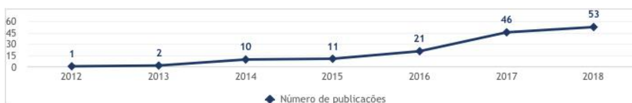
Figura 2: Evolução do número de publicações por ano.

Considerando apenas os artigos incluídos no mapeamento sistemático, a figura 1 exibe o gráfico com número de publicações totais (somando os artigos das cinco bases selecionadas) ao longo dos anos considerados nesta pesquisa (Filtro 4). Percebemos assim que o número de publicações na área de Big Data em Cidades Inteligentes tem um crescimento notável, demonstrando um maior interesse em publicações e, como consequência, num maior desenvolvimento de arquiteturas para cidades inteligentes.