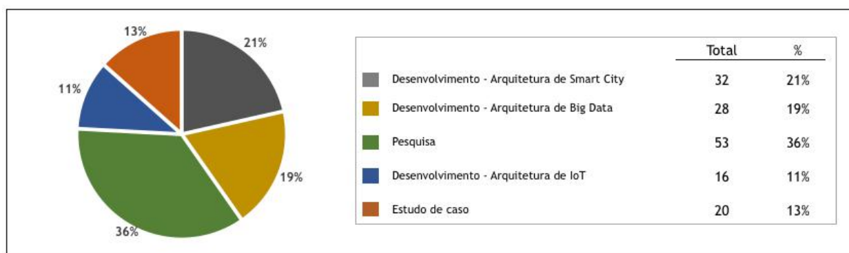
Figura 4: Distribuição de publicações por tipo de objetivo.

É observado que a maior parte dos artigos deste mapeamento é do tipo Pesquisa. Isto deve-se ao fato de o tema Cidades Inteligentes ser relativamente novo, vide distribuição dos artigos da figura 1.