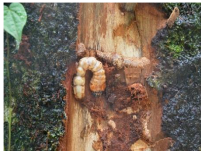
Gambar 2. Gejala kerusakan batang pala akibat hama penggerek

batang 1-2 m dari permukaan tanah. Lubang gergakan tampak adanya garis-garis mendatar dengan ukuran 1,5-2,0 cm dan lebar 2-3 mm, tampak juga serbuk-serbuk kayu bekas gergakan dan pada lubang gergakan keluar cairan atau gum berwarna coklat. Kerusakan terlihat pada tanaman-tanaman yang memiliki lingkaran batang di atas 80 cm atau memiliki diameter batang di atas 25,5 cm. Karakteristik dari larva hama ini berukuran 6-10 cm, berwarna putih agak coklat, dan pada bagian abdomen memiliki ruas 8 – 9, caput berbentuk oval dan berwarna coklat kemerahan (Gambar 2)