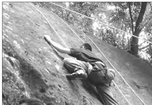
ロッククライミングに挑む学生の姿

野外教育は「一定の教育目的をもって、組織的計画的に行われる自然体験活動」と定義づけられている。飯田(1992)は、「冒険教育とは、自然の中で危険を伴うような野外活動を通じて、様々な困難やストレスを経験し、それを克服することによって感動や成功感を体験し、自己に対する意識の向上を通して人格形成を図るものである」と定義している。