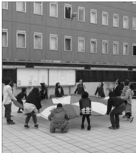
ムーブメントの花形、パラシュートでぬいぐるみをジャンプさせる学生たち。皆の心が一つになりファンタジーの世界に入る。

活動の基本の流れは、先ずフリームーブメントである。ここでは子どもたちは環境に慣れ、自分の好きな遊具で自由に遊ぶ。支援者