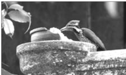
庭の布施台にやってきたコガネゲラ

シンハラ人の中では、鳥やリスに食物を与える光景を良く見かける。コロンボ中心部でもインコやカッコウの類、キツツキ、オオトカゲが珍しくない。コロンボ大学ではカラスやハトの侵入を防ぐために、各教室の窓には鉄格子を設置している。スズメは幸福をもたらす鳥として好まれており、居間の中や玄関口などに巣箱を設置して招き入れている。