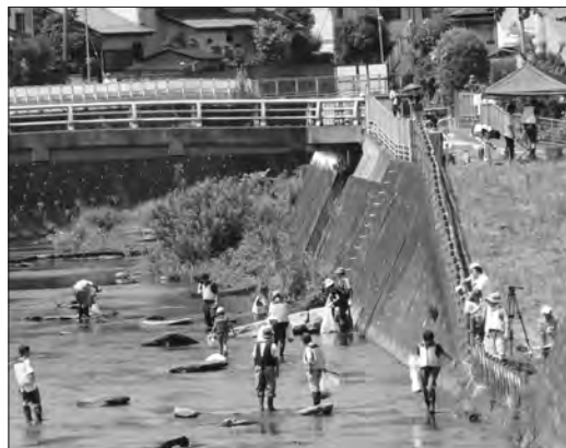
地域の人々と川のクリーンアップをする学生たち (鶴見川大正橋付近)

全活動だけではない。地域の子も向け自然観察会を開催したり、正月の行事どんど焼きや、町内会の盆踊りである納涼祭にも準備から参加している。