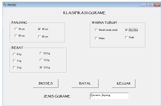
Gambar 2. Form Proses dan hasilnya

Sistem yang dirancang dapat memberikan output berupa jenis gurame bibit unggul