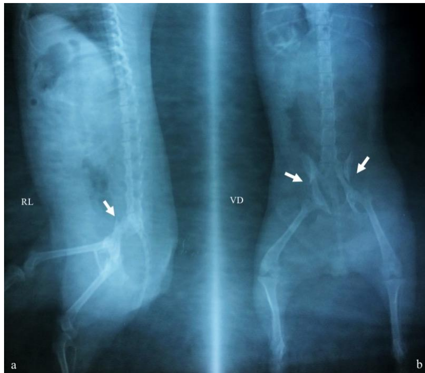
Gambar 1 Hasil foto radiografi fraktur pelvis pada anjing posisi; (a) right lateral (RL) dan (b) ventro dorsal (VD). Tanda panah putih merupakan area patahan berbentuk oblique

(Ketamil ® , Troy Laboratories PTY Limited, Australia) dosis 20 mg/kg BB IM.