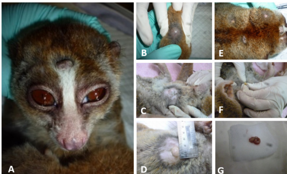
Gambar 1. Massa tumor (panah) tersebar pada hampir seluruh kulit bagian tubuh kukang baik kulit kepala (A), kulit kaki (B), kulit abdomen (C, D), dan kulit torak (E), serta pengeluaran material dari massa tumor (F-G).

Hasil hematologi menunjukkan nilai yang tidak terlalu signifikan, sementara itu hasil biokimia darah menunjukkan tingkat kalsium yang rendah (Tabel 1). Pemeriksaan foto x-ray menunjukkan tingkat opasitas yang rendah dari jaringan tumor dan gambaran sebaran tumor tidak tampak pada hasil