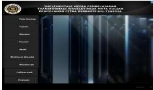
Gambar 2. halaman menu utama

Tampilan halaman menu utama pada Gambar 2 ditampilkan ketika tombol masuk pada halaman opening diklik. Terdapat Sembilan tombol utama yaitu tombol peta konsep untuk menuju halaman peta konsep, tombol tujuan untuk menuju ke tampilan tujuan, tombol wavelet untuk menuju ke tampilan wavelet , tombol fourier untuk menuju ke tampilan fourier , tombol skala untuk menuju ke tampilan skala, tombol multilevel wavelet untuk menuju ke tampilan multilevel wavelet , tombol wavelet 2D untuk menuju ke tampilan wavelet 2D , tombol latihan soal untuk menuju ke tampilan latihan soal dan tombol evaluasi untuk menuju ke tampilan evaluasi.