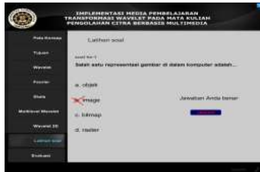
Gambar 10. halaman latihan soal

Tampilan halaman latihan soal pada Gambar 10 terdapat soal latihan yaitu latihan dalam bentuk pilihan ganda dengan empat tombol pilihan jawaban A, B, C dan D setiap memilih jawaban akan muncul konfirmasi dan pilihan jawaban kemudian akan menuju ke soal yang selanjutnya.