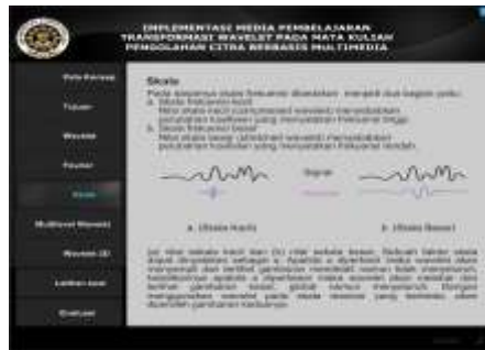
Gambar 7. halaman skala

Pada tampilan halaman skala pada Gambar 7 berisi penjelasan singkat tentang meteri skala dan terdapat contoh gambar dari perbandingan skala besar dan skala kecil, Terdapat sembilan tombol pada halaman ini yaitu tombol peta konsep, tombol tujuan pembelajaran, tombol materi wavelet , tombol materi fourier , tombol materi multilevel wavelet , tombol materi wavelet 2D , tombol materi latihan soal dan tombol materi evaluasi.