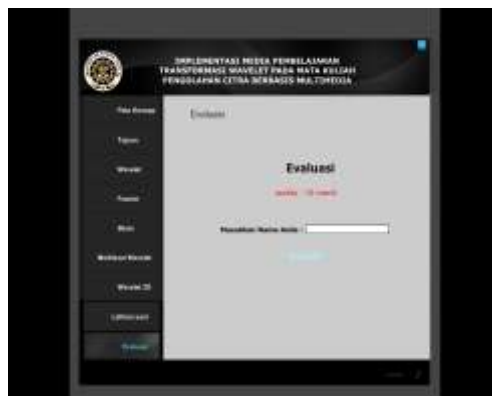
Gambar 11. Halaman evaluasi

Tampilan halaman evaluasi pada Gambar 11 terdapat textbox untuk memasukan nama user , terdapat tombol masuk untuk masuk ke soal.