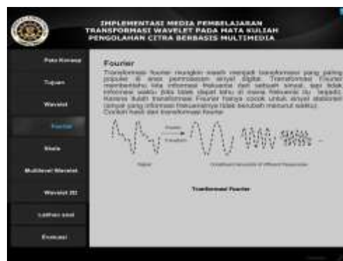
Gambar 6. halaman fourier

Pada tampilan halaman fourier pada Gambar 6 berisi penjelasan singkat tentang materi fourier dan contoh gambar dari transformasi fourier , Terdapat sembilan tombol pada halaman ini yaitu tombol peta konsep, tombol tujuan pembelajaran, tombol materi wavelet , tombol materi skala, tombol materi multilevel wavelet , tombol materi wavelet 2D , tombol materi latihan soal dan tombol materi evaluasi.