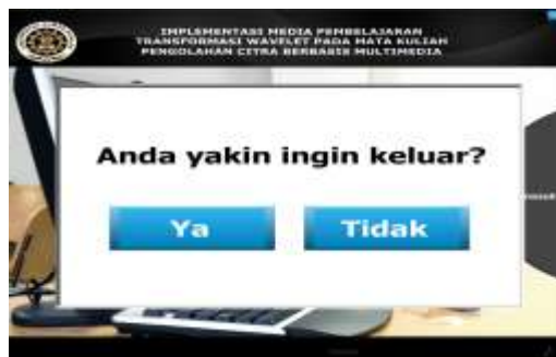
Gambar 14. halaman exit

Tampilan halaman exit pada gambar 14 berisi konfirmasi jawaban untuk mengakhiri aplikasi. terdapat dua tombol ya untuk keluar dari aplikasi dan tombol tidak untuk kembali ke menu utama.