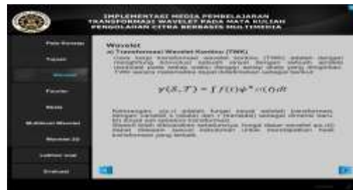
Gambar 5. halaman wavelet

Pada tampilan halaman wavelet pada Gambar 5 berisi penjelasan singkat tentang materi wavelet , Terdapat sembilan tombol pada halaman ini yaitu tombol peta konsep, tombol tujuan pembelajaran, tombol materi fourier , tombol materi skala, tombol materi multilevel wavelet , tombol materi wavelet 2D , tombol materi latihan soal dan tombol materi evaluasi. Tombol next untuk lanjut kehalaman selanjutnya yaitu masuk ke halaman wavelet kontinu dan wavelet diskrit.