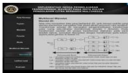
Gambar 9. halaman wavelet 2D

Pada tampilan halaman wavelet 2D pada Gambar 9 berisi penjelasan singkat tentang meteri wavelet 2D , Terdapat sembilan tombol pada halaman ini yaitu tombol peta konsep, tombol tujuan pembelajaran, tombol materi wavelet , tombol