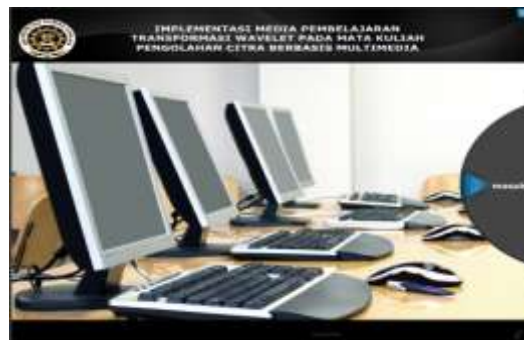
Gambar 1. halaman Opening

Tampilan halaman Opening pada Gambar 1 ditampilkan pertama kali ketika dijalankan aplikasi media pembelajaran dari materi transformasi wavelet . pada tampilan ini menampilkan sebuah gambar serta tombol enter untuk masuk ke menu utama.