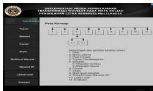
Gambar 3. Halaman peta konsep

Tampilan halaman peta konsep pada Gambar 3 berisi struktur menu dari media pembelajaran. Terdapat Sembilan tombol pada halaman ini yaitu tombol tujuan pembelajaran, tombol materi wavelet , tombol materi fourier , tombol materi skala, tombol materi multilevel wavelet , tombol materi wavelet 2D , tombol materi latihan soal dan tombol materi evaluasi.