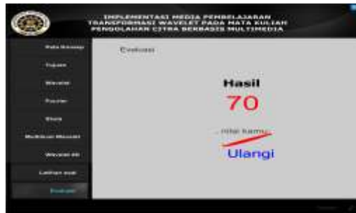
Gambar 13. Halaman hasil evaluasi

Tampilan halaman hasil evaluasi pada Gambar 13 ditampilkan nilai hasil evaluasi yang diperoleh dari jawaban user , terdapat juga tombol ulangi untuk mengulang dari awal.