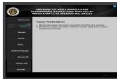
Gambar 4. halaman tujuan pembelajaran

Tampilan halaman tujuan pembelajaran pada Gambar 4 berisi tujuan yang ingin dicapai dengan adanya media pembelajaran ini. Terdapat sembilan tombol pada halaman ini yaitu tombol peta konsep, tombol materi wavelet , tombol materi