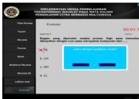
Gambar 12. halaman soal dan konfirmasi jawaban