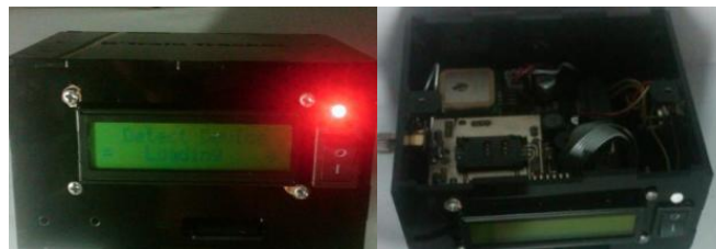
Gambar 2. Tata letak rangkaian elektronik dan box

Desain rangkaian PCB layout dan tempat kotak ( box ) yang dibuat agar mudah dalam perbaikan maupun pengoperasian. Peletakan dengan menggunakan konsep bentuk tumpukan ( stacking ) pada modul rangkaian sehingga lebih sederhana dan mudah untuk perakitan sistem perekam suara, unit kendali, modul GSM dan modul GPS. Dengan metode stacking akan membuat dimensi bisa lebih ramping.