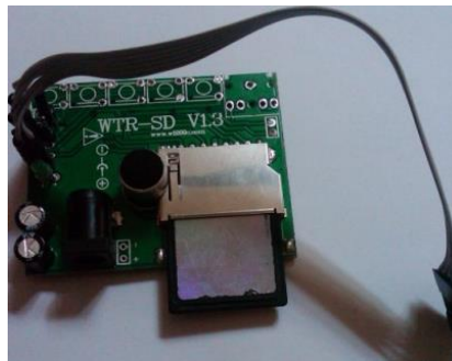
Gambar 1. Modul perekaman suara WTR010