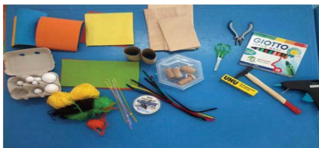
Figura 1. Materiais e ferramentas pré-determinados para realização da atividade

presença do investigador e cada criança apenas participou uma vez), em contexto de jardim de infância (espaço conhecido da criança), numa atividade livre de realização conjunta com materiais pré-determinados pela equipa alemã, responsável pelo estudo Tandem original (Brandes et al., 2012). (cf. Figura 1).