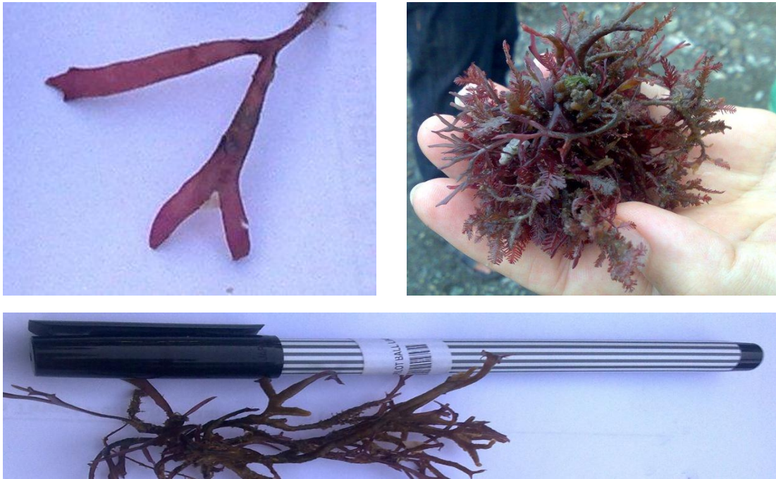
Gambar 2. Organ yang diduga kuat sebagai sporangia pada thallus G. acerosa (kiri atas); bibit utuh yang sehat (kanan atas); "stek" tanpa holdfast yang kurang berkembang (bawah)

Propagasi vegetatif Gelidiella acerosa , termasuk kultur jaringan dan penggunaan hormon pertumbuhan, belum membuahkan hasil yang memuaskan namun metode reproduksi melalui spora telah dikembangkan (Jayasankar dan Vaghese, 2002). Metode mirip dengan budidaya beberapa jenis Moluska dimana spat dapat melekat dan berkembang pada berbagai jenis substrat buatan.