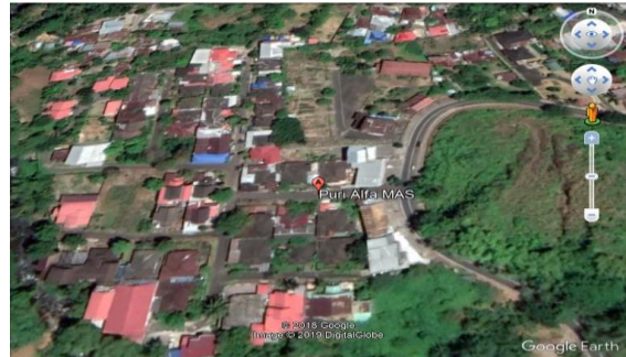
.Gambar 2. Lokasi Penelitian

Lokasi Penelitian bertempat di Perumahan Puri Alfa Mas Winangun Atas Kabupaten Minahasa, Sulawesi Utara.