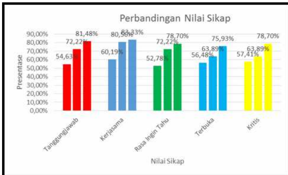
Gambar 1. 2. Grafik Pengamatan Sikap Siswa pada Pra tindakan, Siklus I dan Siklus II

ditunjukkan dengan meihat grafik perbandingan peningkatan sikap siswa pada setiap siklus sebagai berikut: