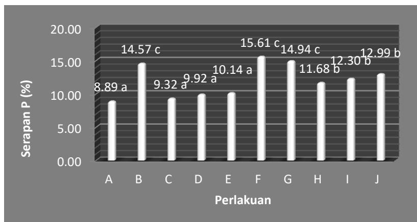
Gambar 2. Grafik pengaruh perlakuan terhadap serapan P.

dosis. Hal ini karena unsur N, P dan K yang menjadi komponen menyusun PCO berjumlah sedikit.