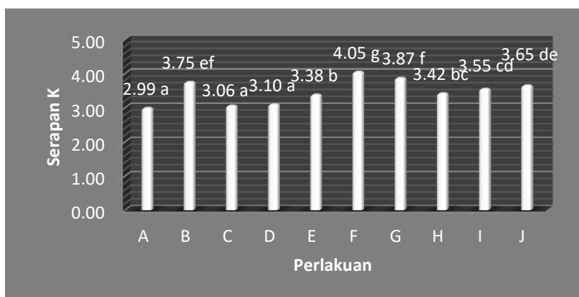
Gambar 3. Grafik pengaruh perlakuan terhadap serapan K.