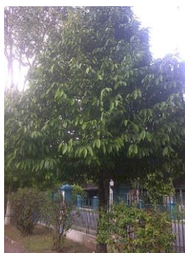
Gambar 1. Tanaman Kepel

Tanaman kepel ( Stelechocarpus burahol , (Bl.) Hook f. & Th.) (famili Annonaceae) yang digunakan dalam penelitian dideterminasi di Laboratorium Biologi Fakultas Farmasi, Universitas Gadjah Mada. Tujuan determinasi adalah memastikan bahwa tanaman yang diteliti adalah benar tanaman kepel, menghindari kesalahan dalam pengumpulan bahan utama penelitian. Hasil determinasi menyatakan bahwa spesimen tumbuhan tersebut adalah benar. Hasil determinasi tersebut berdasarkan buku Flora of Java Vol II (Backer and Van Den Brink, 1965). Gambar tanaman kepel terlihat pada Gambar 1.