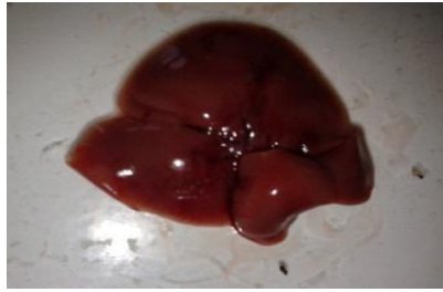
Gambar 1. Makroskopi hepar mencit setelah perlakuan pada kelompok V