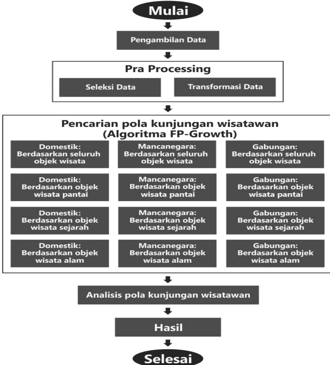
Gambar 1. Alur Metodologi Penelitian