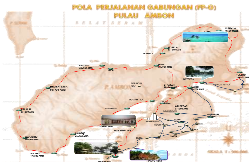
Gambar 5. Kunjungan Wisatawan Gabungan ke Berbagai ODTW Menggunakan FP-Growth