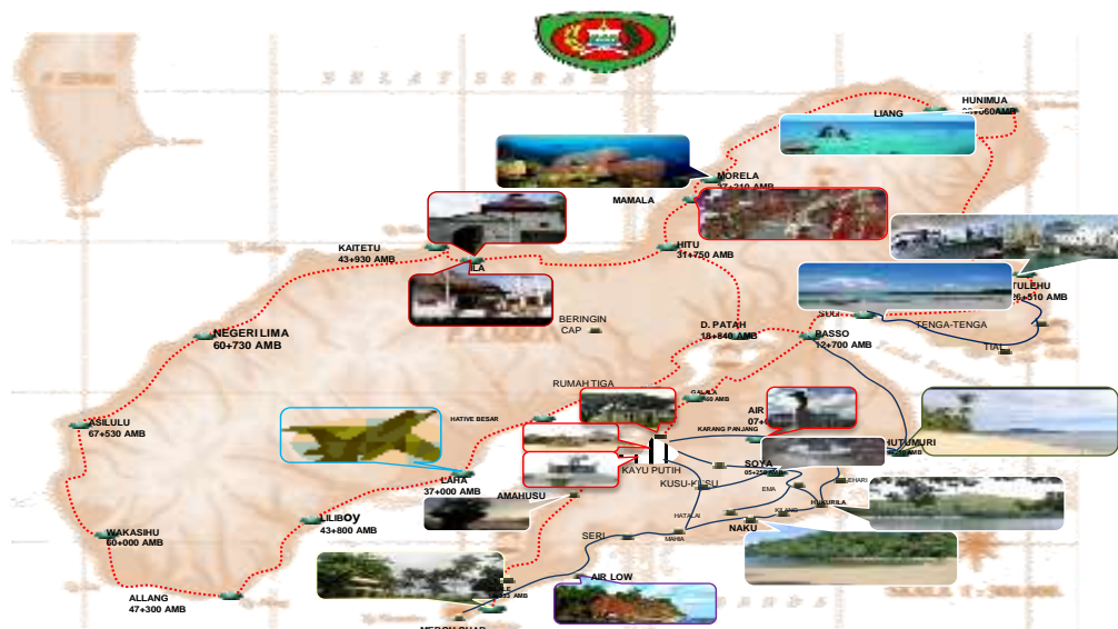
Gambar 4. Kunjungan Wisatawan Gabungan ke Berbagai ODTW

Perbandingan gambaran pola kunjungan wisatawan Gabungan ke berbagai objek daya tarik wisata di pulau Ambon secara manual dengan menggunakan FP-Growth. Pada gambar 4. Yang merupakan data manual hasil workshop tim penyusun pola perjalanan wisata di pulau Ambon (Travel Pattern) tahun 2013, disitu menunjukkan banyak dan lamanya waktu tempuh untuk mengunjungi masing-masing objek daya tarik wisata di pulau Ambon yang sedikit bertolak belakang dengan keinginan tour dari wisatawan yang memiliki waktu singkat untuk dipulau Ambon (1 x 24 jam). Untuk menyiasati hal tersebut dibuatlah paket tour singkat berdasarkan pola kunjungan wisatawan terbanyak ke berbagai objek daya tarik wisata pulau Ambon menggunakan metode FP-Growth adapun contoh hasil gambaran wisatawan Gabungan menggunakan FP-Growth dapat dilihat pada Gambar 5. Dari hasil FP-Growth didapatkan pola kunjungan wisatawan Gabungan singkat yang berkunjung ke beberapa objek daya tarik wisata di pulau Ambon.