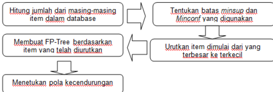
Gambar 2. Alur Algoritma FP-Growth