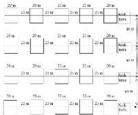
Gambar 1. Model pembuatan jalur plot yang akan di amati.

Metode jalur merupakan metode yang paling efektif mempelajari perubahan keadaan vegetasi menurut kondisi tanah, topografi, dan elevasi (Soerianegara dan Indrawan, 1982 dalam Indriyanto, 2006). untuk lebih jelasnya pembuatan jalur dan plot yang akan diamati pada gambar :